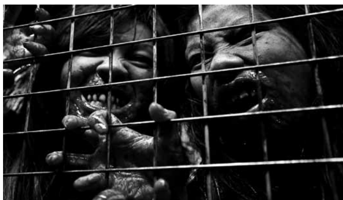
The Loved Ones i (2009) i La Horde (2009).