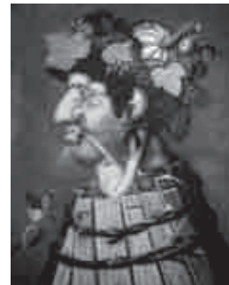
G. Arcimboldo, Otoño , 1573 5 .

Otro elemento relevante en la retratística es el perfil del rostro, que ha sido heredado de las representaciones reales en monedas y medallas.