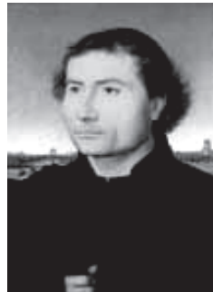
H. Memling, Portrait of a Man , c.1470.