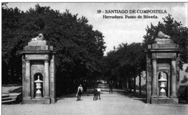
Dúas imaxes do Paseo da Bóveda ou da Ferradura na Alameda compostelá tomadas nos primeiros anos do pasado século.

Despois, abrazaron ao Apóstolo e pasaron pola Porta Santa lucindo a medalla dos peregrinos. Pola noite ofrecerían a segunda función.