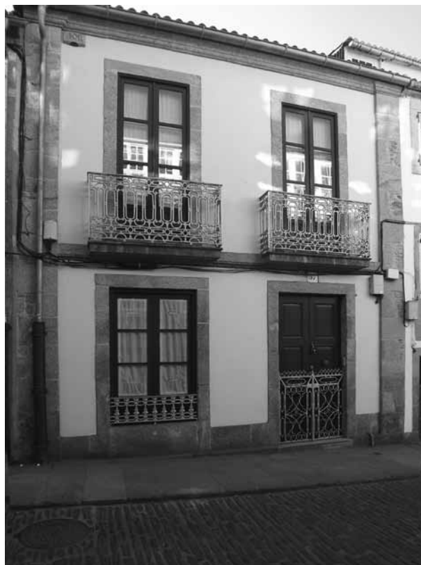
Foto actual da casa da Rúa das Hortas nº 37, na que Camilo Díaz Baliño tiña o taller.

Cando menos a capacidade de diálogo, que é por onde se ten que escomenzar, era a mais viva e aberta