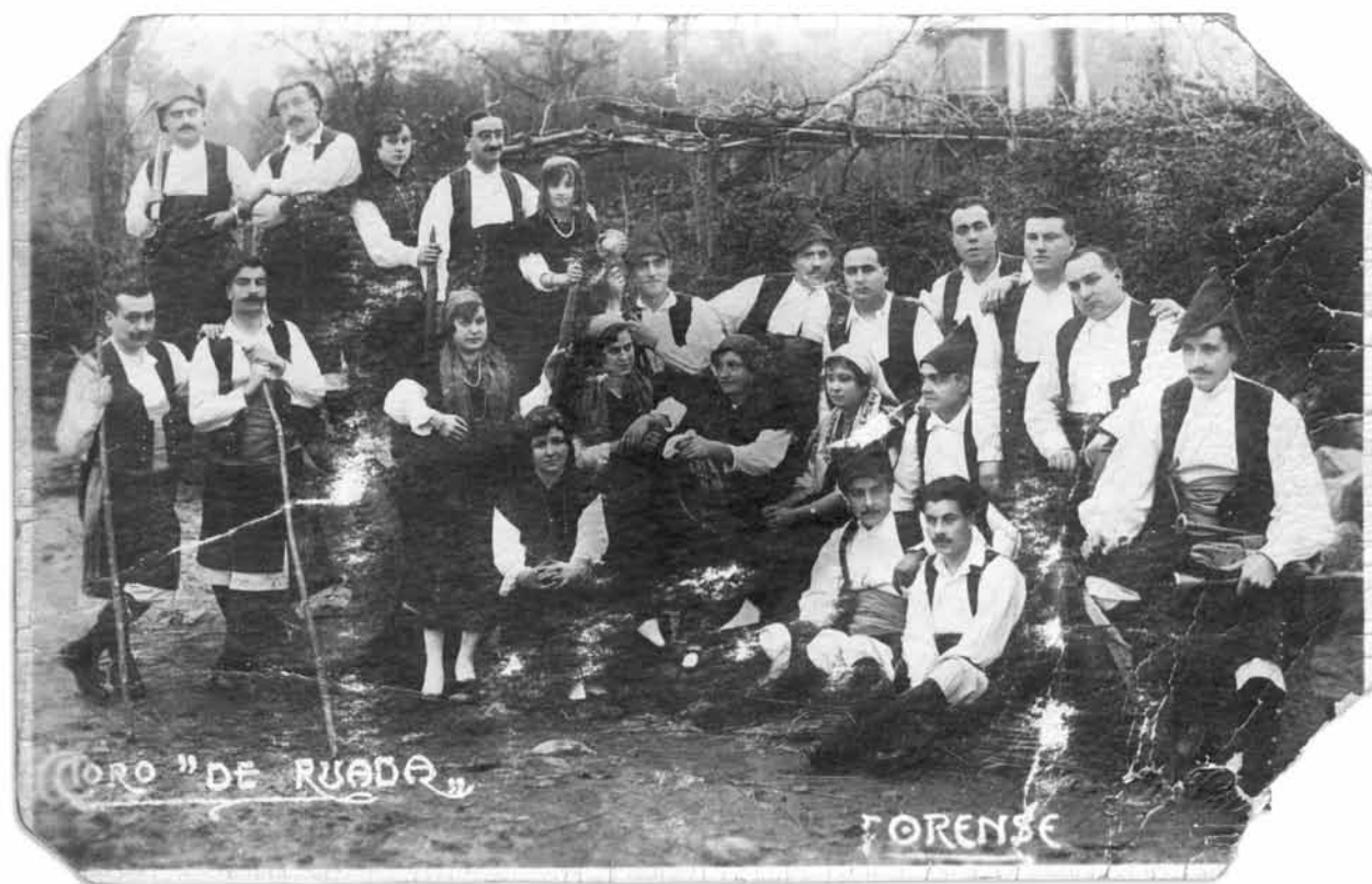
Segunda foto oficial do CORO DE RUADA, tomada en Peliquín en 1920