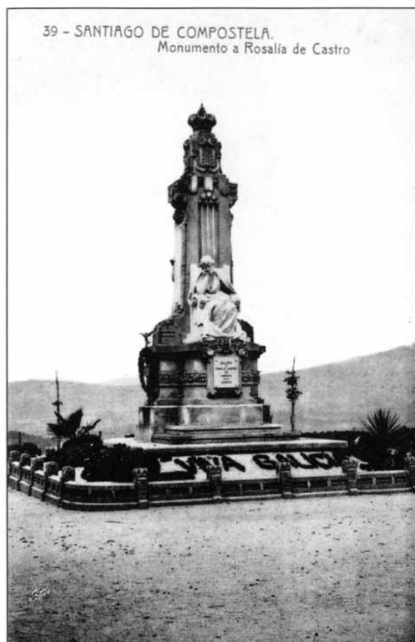
Monumento a Rosalía Castro no Paseo da Ferradura da Alameda de Santiago.