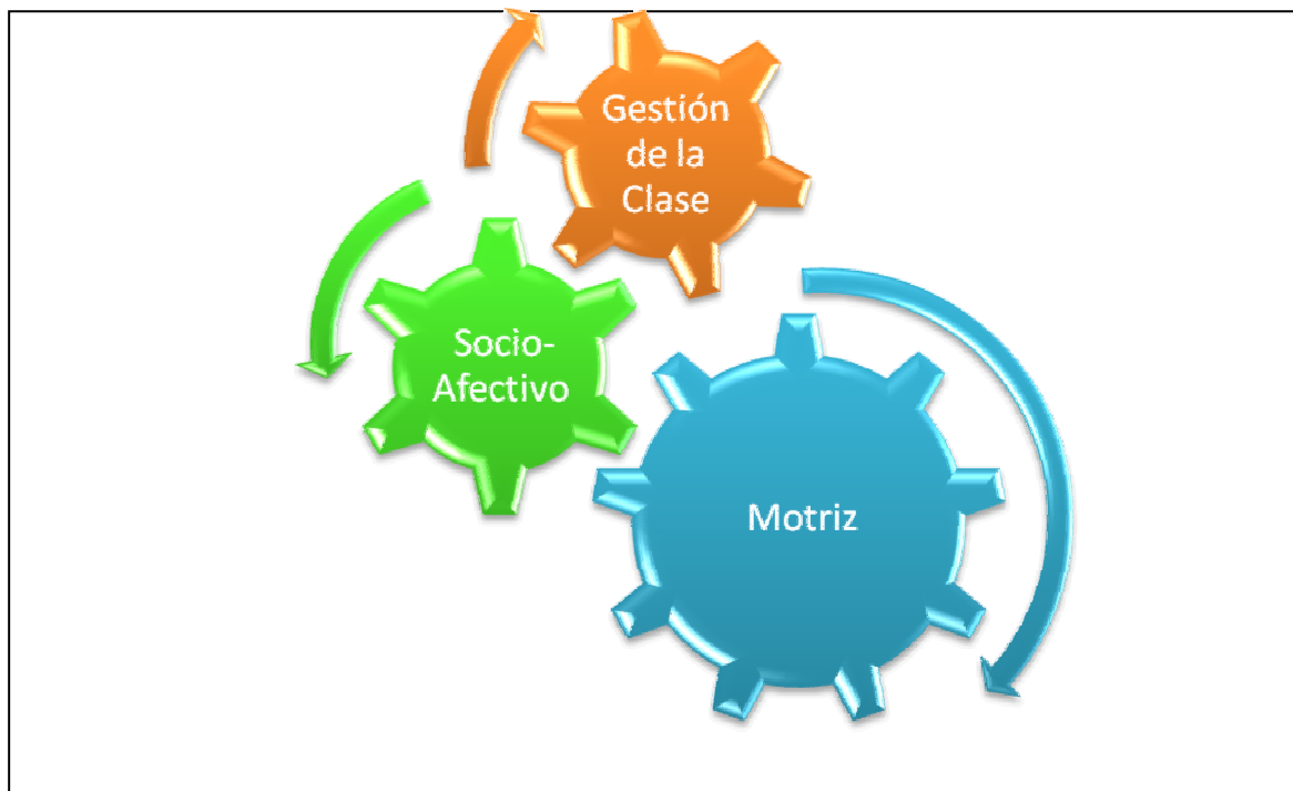
Figura 1. Puntos de vista organizativos en las clases de Educación Física.

En este sentido, y siguiendo a Viejo (2004) la organización cumple las siguientes funciones: