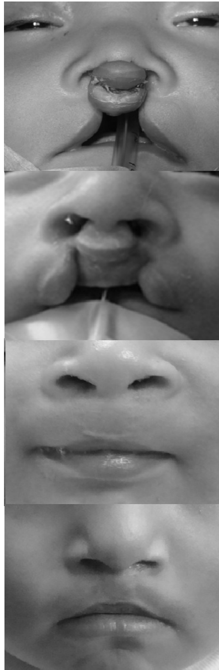
FIGURA 5. Postoperatorio de queilorrinoplastia primaria con doble avance y rotación lateral.

La presencia de complicaciones postoperatorias fue poco frecuente, siendo la cicatriz hipertrófica (más del 50 % de las complicaciones) la más común de observar. Ver Tabla 3.