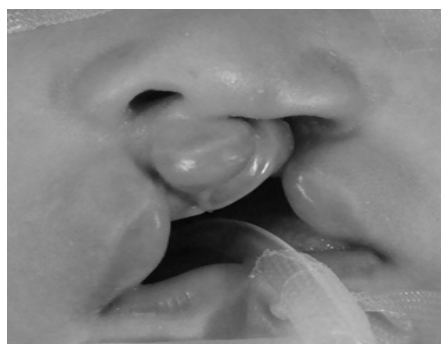
FIGURA 2. Fisura labial bilateral con asimetría de los segmentos labiales laterales.

La técnica quirúrgica utilizada se describe a continuación. Marcaje. Ver Figura 3.