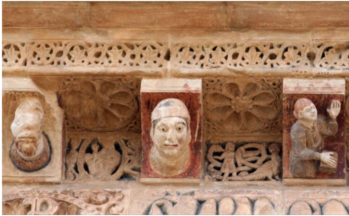
FIG. 3. MÈNSULES DE L'ANUNCIATA DESPRÉS DE LA SEVA RESTAURACIÓ