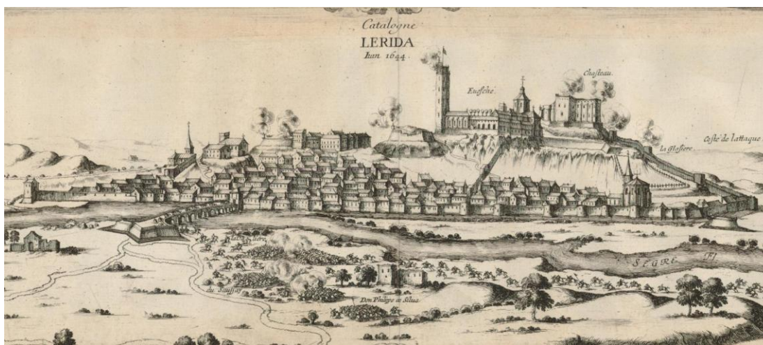
FIG. 1. DETALL DEL GRAVAT ATRIBUÏT A SEBASTIEN DE BEAULIEU QUE MOSTRA LA BATALLA DE LA GUERRA DELS SEGADORS A LLEIDA, L'ANY 1644

fortificat, el Castillo Principal , i va convertir la catedral en caserna 10 , funció que va desenvolupar fins a l'any 1948. Aquest període és capital per explicar i entendre totes les restauracions que s'han portat a terme al monument durant el segle XX i fins a l'actualitat, així com l'aspecte que ofereix avui en dia. S'ha de posar l'èmfasi en què durant aquests gairebé dos segles i mig va canviar completament el seu entorn urbà, fins al punt que va desaparèixer el barri medieval de la Suda, que envoltava la catedral, i el conjunt es va segregar de la trama urbana de Lleida.