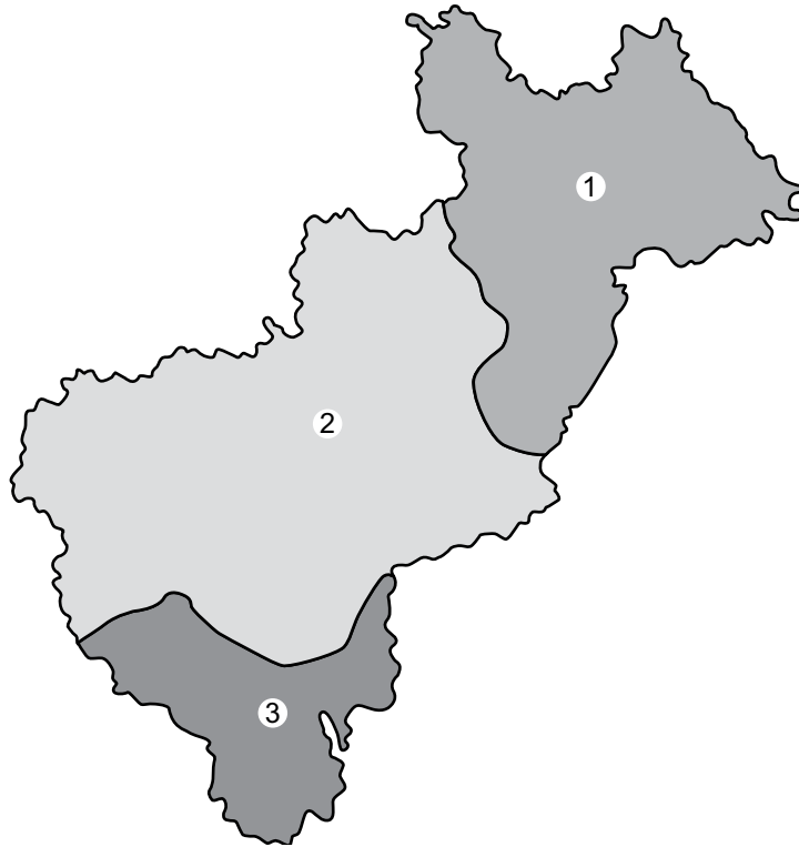
Fig. 1. Regiones fisiográficas del estado de Querétaro. 1. Sierra Madre Oriental. 2. Altiplanicie Mexicana. 3. Eje Volcánico Transversal.

Para una definición más amplia y detallada de los aspectos ambientales, así como de las características de la flora y de la vegetación del estado, cabe consultar el trabajo de Zamudio et al. (1992).