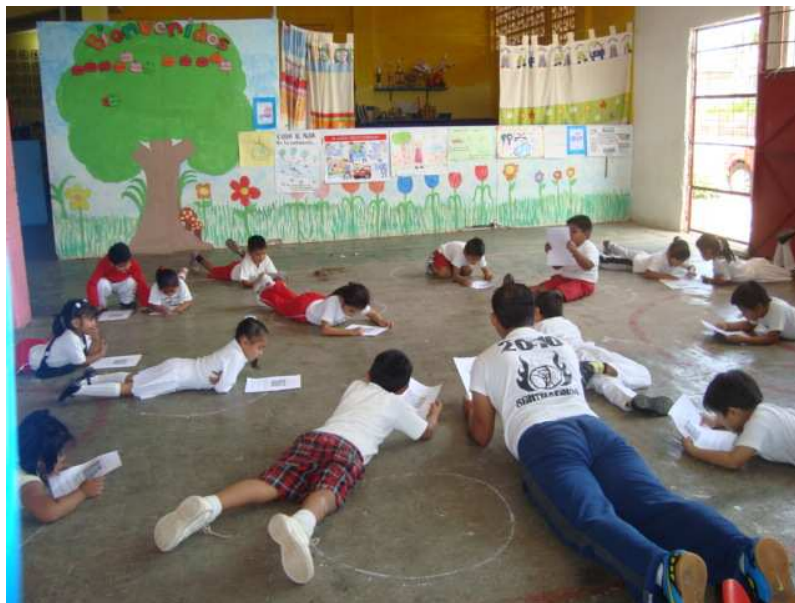
Imagen 3. Alumnos interactuando con el mundo de la información y el conocimiento.

No cabe duda que los docentes debemos ser los primeros en actuar, es decir que desde las acciones que se implementen como formador sean a partir de un cambio de mirada en la escuela, es así que voy a compartir a continuación dos puntos relevantes para alcanzar esta transformación de la práctica docente en la educación física.