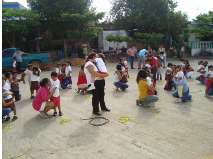
Imagen 2. Practica formativa en desarrollo de competencias.

A todo esto, la educación física como asignatura perteneciente al currículum de la educación básica es parte primordial para alcanzar el desarrollo de las competencias básicas o llave como las designa la DeSeCo 1 . La educación mediante el movimiento corporal intencionado, consciente y reflexivo es parte de una práctica formativa de habilidades, conocimientos, actitudes, fomento de valores y el desarrollo del aspecto emocional. Con lo anterior estamos hablando de una educación física holística, integradora con miras a desarrollar las competencias llave.