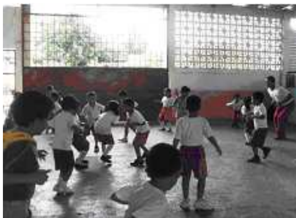
Imagen 1. Ambientes reales para construcción del conocimiento y significados.

Está claro que la finalidad de la educación básica es crear escenarios o ambientes reales del contexto y donde el estudiante construya sus conocimientos y significados, de esta forma adquiera aprendizajes relevantes, es decir lo que aprenda en la escuela debe ser útil para su vida, por consiguiente vivir en plenitud y feliz como lo propone Pérez Gómez (2009).