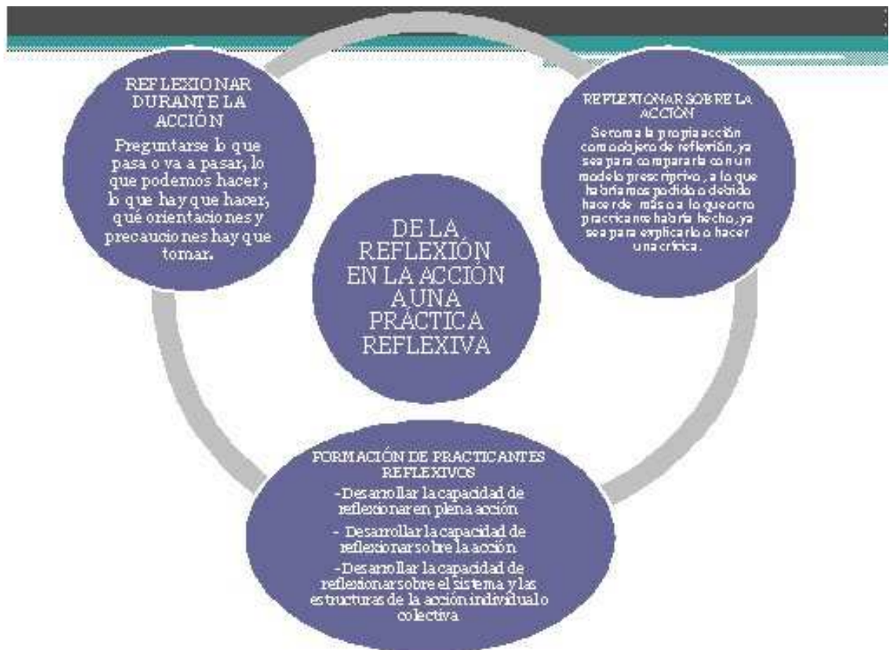
Esquema 1. De la reflexión en la acción a una práctica reflexiva

Hasta ahora, ya hemos hablado de la importancia de la reflexión sobre la práctica pedagógica de los maestros para la construcción de los saberes, del conocimiento profesional y de las competencias docentes, que esto último es lo que se pretende que alcancen todos los profesores, ser personas que sepan actuar moviendo todos sus acervos en la consecución de aprendizajes en los alumnos.