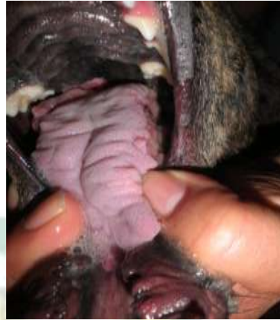
Foto 2. Lengua. Post tratamiento.