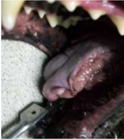
Foto 1. Lengua. Lesión granulomatosa

Urb. Nueva Segovia, calle 4 entre carreras 2 y 3, N° 2-41. Quinta CEPROUNA Teléfonos (0251) 719.22.83 – 240.63.66. Barquisimeto - Estado Lara RIF.: J-30496804-3 ppi: 201102LA3870 ISSN: 2244 – 7733