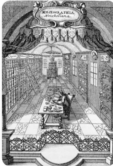
Tratado escrito por Caspar Friedrich Neickelius (1727)

Este tratado recogía toda una serie de explicaciones respecto a la disposición de las colecciones en los espacios designados para tal fin, así como los criterios para su registro, inventario y catalogación de los objetos, recomendando el uso de elementos originales sobre las reproducciones, así como las condiciones óptimas para su mantenimiento.