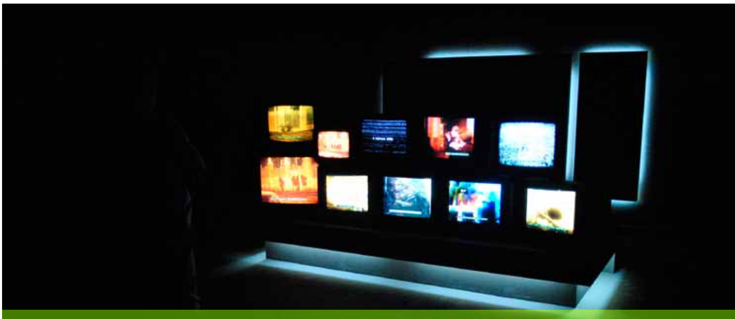
Salas Expositivas del Museo Alejandro Otero