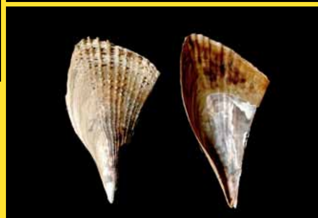
Piezas de colección