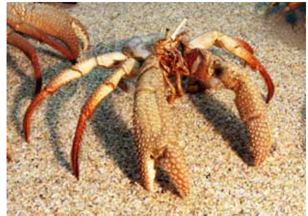
Ejemplar de la colección

El Museo del Mar de la Universidad de Oriente, fue inaugurado el 12 de Octubre de 1984, en la avenida Universidad de la ciudad de Cumaná, estado Sucre, Venezuela. Su principal colección proviene del trabajo de investigación de científicos y taxidermistas del Instituto Oceanográfico de Venezuela, espacio donde inicialmente estaba expuesta, por lo que sólo podía ser apreciada por los Universitarios y aquellos que se acercaban al recinto.