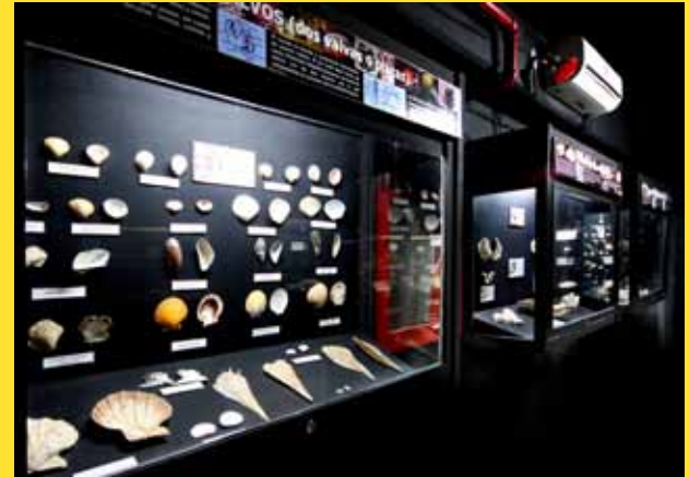
Áreas de exposición

Por inquietud del entonces Director del Instituto nace la propuesta de crear el Museo del Mar. Luego de múltiples conversaciones y acuerdos el museo es inaugurado en las edificaciones del antiguo aeropuerto de la ciudad de la Cumaná. Entre 1997 y el 2005 el museo permaneció cerrado debido a razones económicas, el estado de deterioro de la edificación y posteriormente