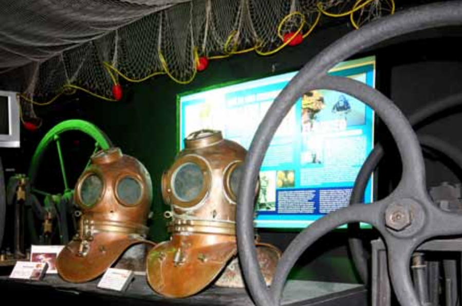
Piezas de colección