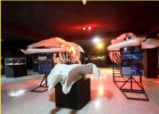
Áreas de exposición