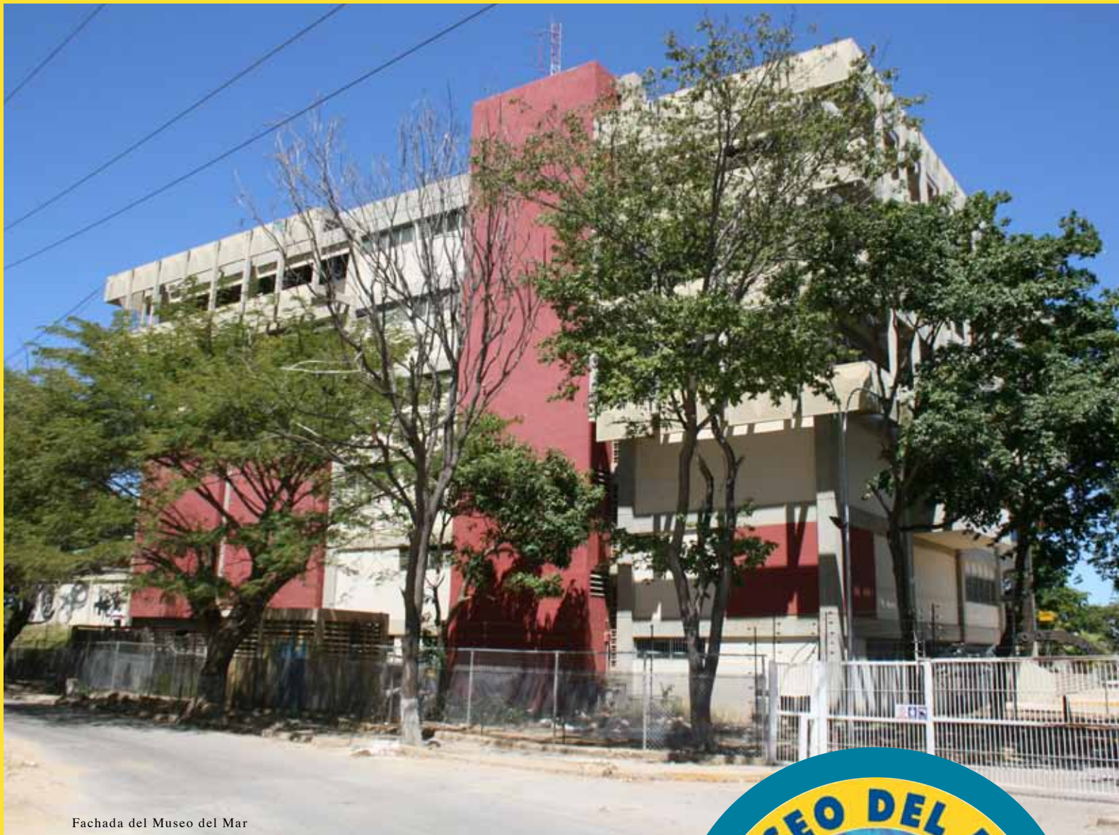
Fachada del Museo del Mar