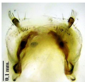
Figura 3. Ginopigio

1 individuo hembra procedente de Barranco de Teatinos, río Darro, Quéntar, Granada; UTM: 30SVG51; 30/06/2004; A. Anichtchenko leg., Verdugo coll.