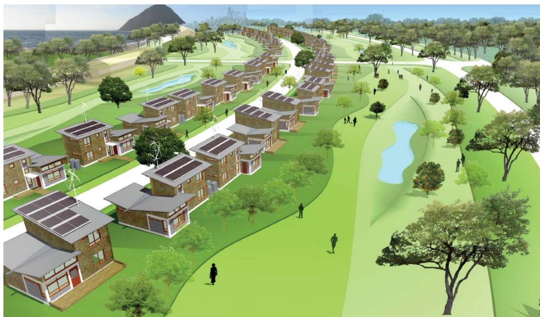
Figura 5. Perspectiva 3D del Clúster residencial de la nueva Eco-Villa de Chaitén

Además cada clúster incluye senderos y áreas peatonales como también calles de acceso vehicular. Es así como la idea general del clúster es de crear un área que puede concentrar diversas actividades, contribuyendo a la optimización del espacio y la mejor infraestructura para sus habitantes. Asignando estos diferentes conceptos pueden enriquecer las estrategias de diseño de las viviendas como también de las condiciones del contexto circundante, creando el diseño integral que es parte de un todo unificado, pero con sus específicas y distinguidas partes.