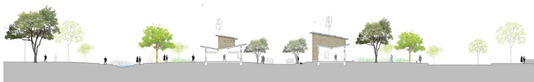
Figura 6. Corte transversal del Clúster Residencial y estereotipos de viviendas

El uso de materiales locales reduce el costo de traslado y transporte, en especial en esta ubicación que se encuentra muy lejana a centros urbanos cercanos. Además estimulara la economía local a través de la creación de nuevos puestos de trabajos. Como parte de la estructura, en especial la envolvente juegan un rol importante en el diseño para cada prototipo de vivienda. Las condiciones climáticas, como las de Chaitén, son de relevante importancia y deben ser consideradas. La envolvente tiene que ser lo más hermética y con un gran valor de R, manteniendo así el calor dentro de las viviendas y el frío afuera. Es así como la dimensión de los muros juegan un rol importantísimo, ya que así se puede colocar aislación térmica rígida de gran espesor, la que es más eficiente en términos térmicos, generando espacios interiores más cómodos y mejor sellado.