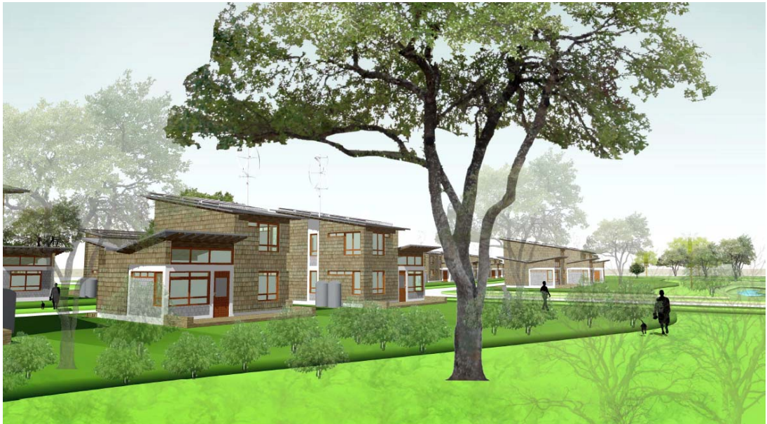
Figura 8. Perspectiva de las huertas y jardines comunitarios de la nueva Eco-Villa de Chaitén