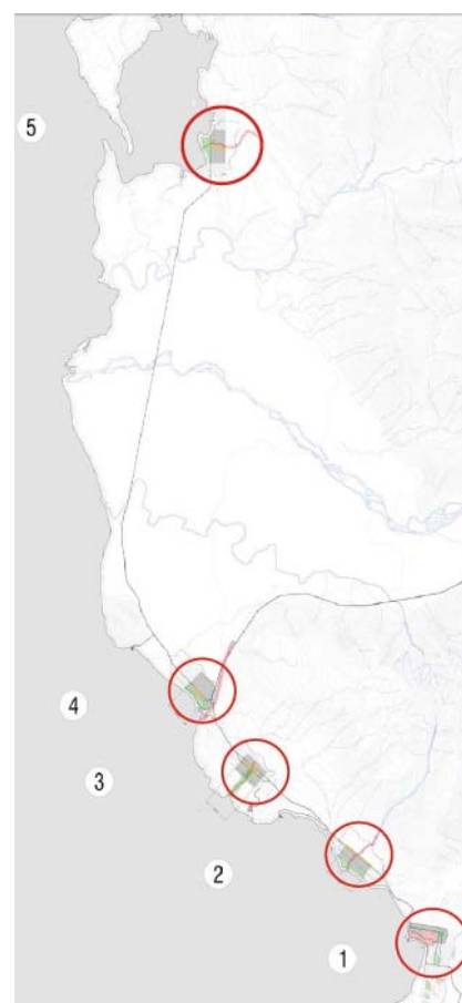
Figura 2. Emplazamiento y alternativas

Para cada variable se desarrollo un esquema donde el color más claro representa áreas favorables para el asentamiento y más oscuras menos favorables. Luego y para mejor entendimiento y correspondencia entre las áreas favorables estudiadas, se crearon otros diagramas de sobreposición donde se