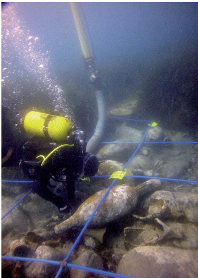
Arqueòleg realitzant treball d'excavació.

Per últim hi trobem el grup més nombrós dins les aigües de la cala Aiguablava, les àmfores. La seva funció era la d'emmagatzematge de productes per a ser transportats com el vi, l'oli o els salaons, convertint-se així en un dels objectes més importants dins la vida quotidiana i també per l'estudi del comerç i la història econòmica d'Època Antiga. Hi trobem àmfores d'arreu