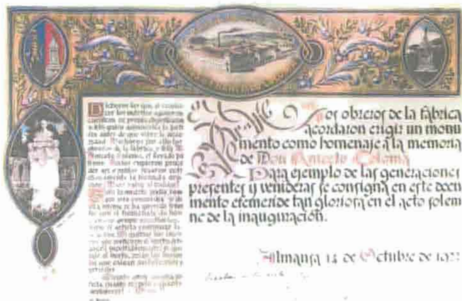
Fot. 9. Recordatorio de la inauguración del monumento.

Dichosos los que al reconocer los méritos ajenos encuentran su propia dignificación y feliz quien administra la justicia antes de que vibre la necesidad. Dichosos por ello los obreros de la fábrica y feliz D. Aniceto Coloma, el llorado patrono. Todos supieron proceder así, y juntos rezaron cotidianamente la fecunda oración ¡Dios salve al trabajo!