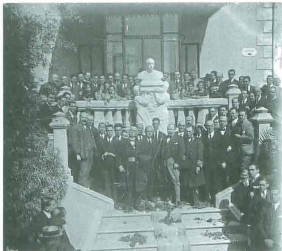
Fot. 8. Inauguración del monumento. (Se puede apreciar la alfombra que se instaló para el día de la inauguración y las flores que están en los peldaños de las escaleras. A la derecha de la escultura aparece de lado Mariano Benlliure).