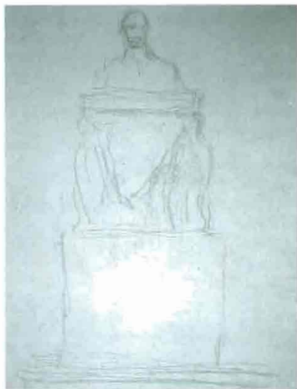
Fot. 5. Dibujo del monumento de don Aniceto Coloma. Volumen IV del Cuerpo Gráfico de Arte Valenciano. Museo Nacional de Cerámica y de las Artes Suntuarias "González Martí" de Valencia.