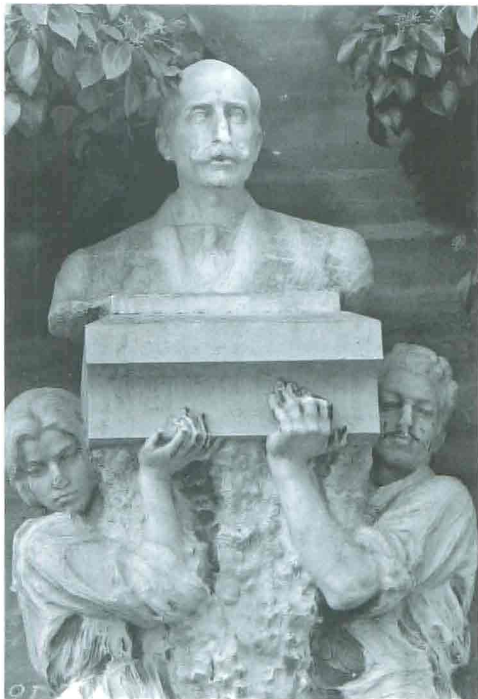
Fot. 10. Monumento de don Aniceto Coloma antes de la restauración.