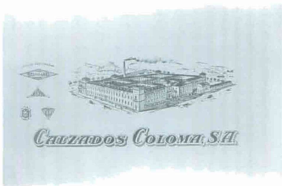
Fot. 1. Fábrica Calzados Coloma. Almansa.