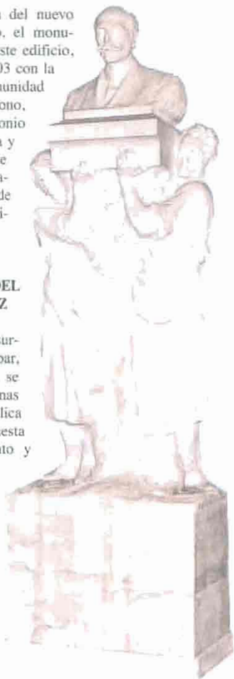
Fot. 11. Monumento de don Aniceto Coloma. (Foto: Cecilio Sánchez Tomás).

En torno a la problemática surgida sobre el lugar que debía ocupar, una vez restaurado el monumento, se sumó el hecho de que algunas personas solicitaban que se realizara una réplica del mismo. En un principio la propuesta fue estudiada por el Ayuntamiento y pensó en instalar la nueva obra en el lugar donde había estado estos últimos años. Esta idea fue desechada ya que los expertos consideraron que hacer una réplica exacta del original supondría dañarlo, ya que se tendrían que sacar una serie de moldes para realizar la nueva escultura y además suponía un costo mayor. Debido a que esta propuesta no prosperó, se pensó en instalar una placa conmemorativa, recordando el lugar que ocupó el monumento y la fábrica de los