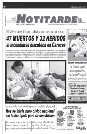
Todos los Derechos Reservados. © Copyright 2001 Editorial Notitarde C.A. Diseño y Tecnología: JI Creative

No es diferente con el segundo titular, en la que la modalidad exclamativa determina la lectura, la interpretación y la posición del medio. Nótese la diferencia del tratamiento que hace el medio sobre el mismo acontecimiento unos días antes: