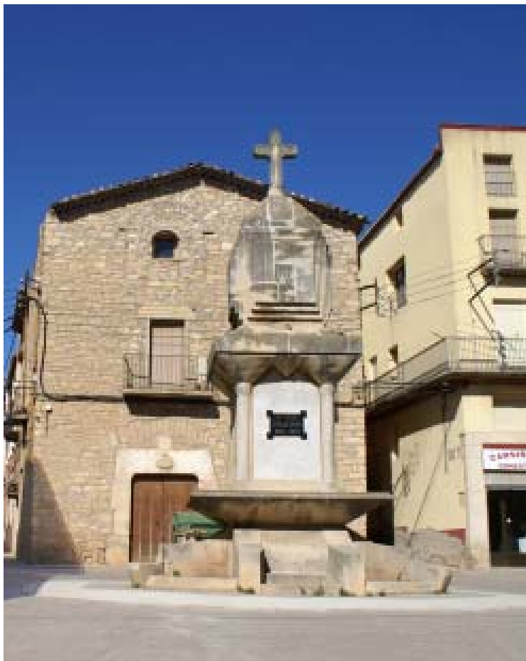
FOTO 3 El «monument» abans del darrer acondicionament, agost de 2010 ( autor Jordi Travé )