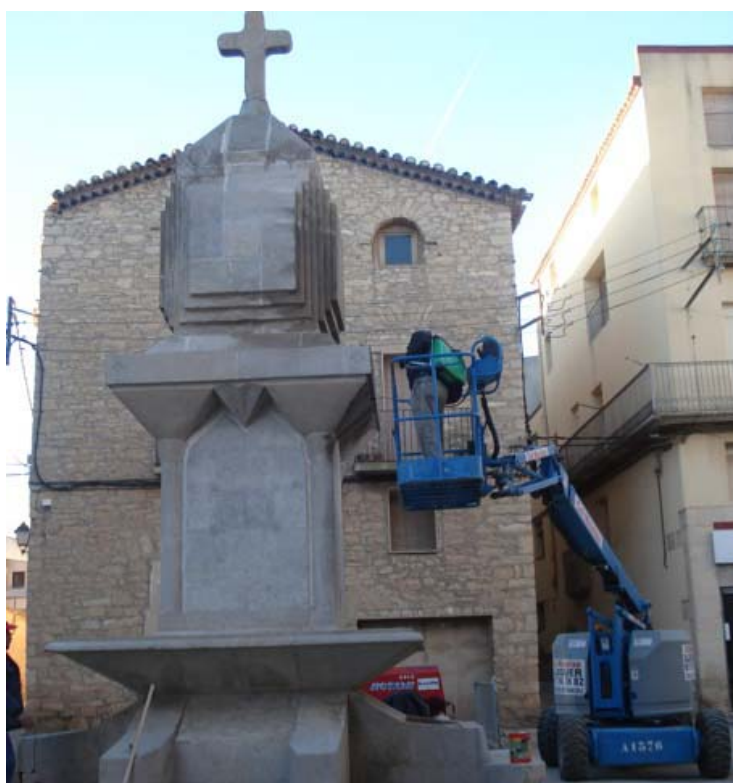
FOTO 4 Obres d'acondicionament del «mo-nument», el 20 de desembre de 2010