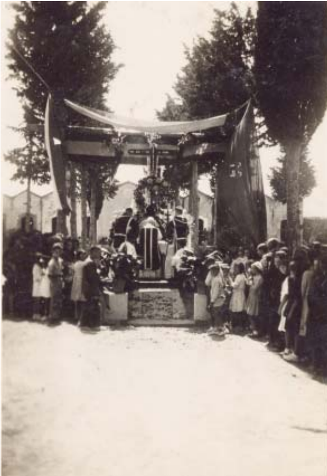
FOTO 28 Inauguració del panteó, l'any 1941, sense la làpida dels enterrats, que fou col·locada el dia 12 de febrer de 1942