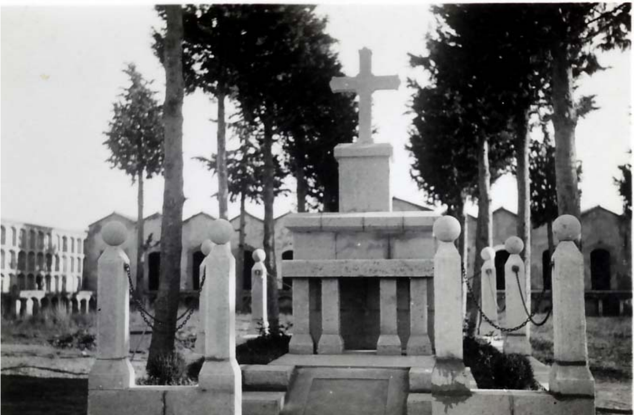
FOTO 29 El panteó preparat i a punt de la seva inauguració l'any 1941