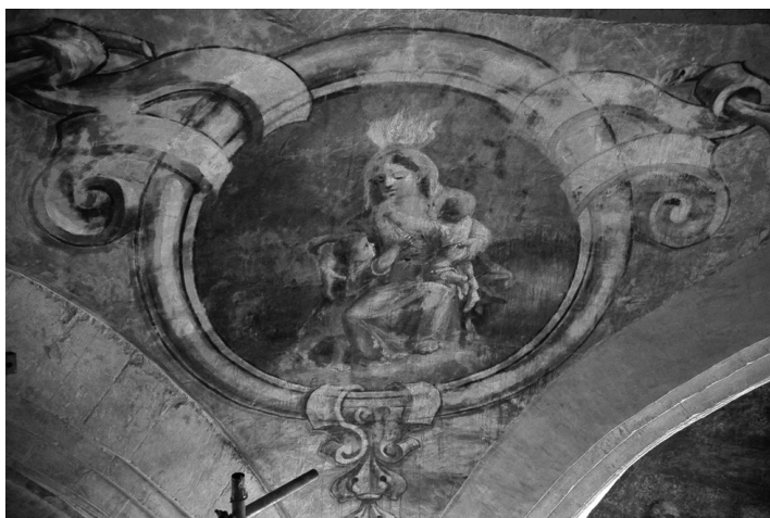
Fig. 4 Virtuts . Virtuts teogonals representades a les petxines que sostenen la volta