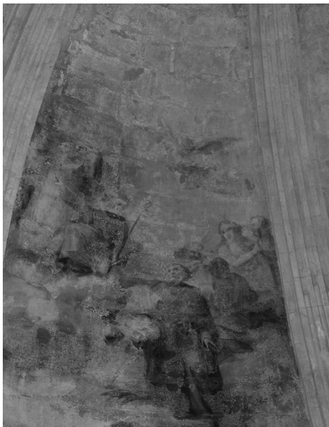
Fig. 6 Plafó Sants

Dos dels plafons que representen els estadants del cel