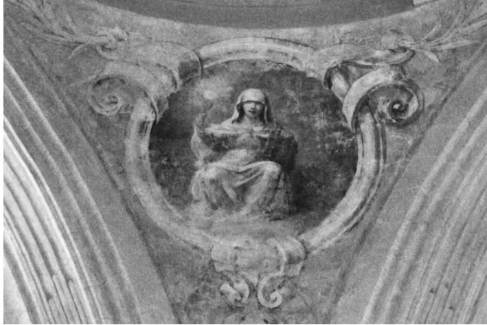
Fig. 2 Fe