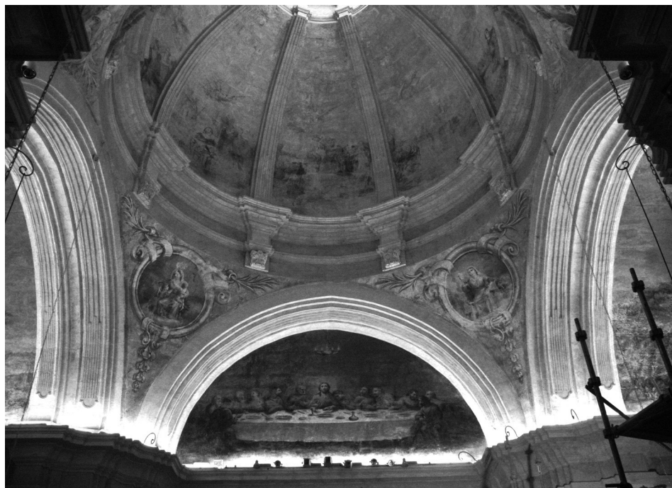
Fig. 7 Sant Sopar . Secció de la capella on es poden veure la lluneta dedicada al sant Sopar, les virtuts representades a les petxines i alguns segments de la volta amb la disposició de la iconografia