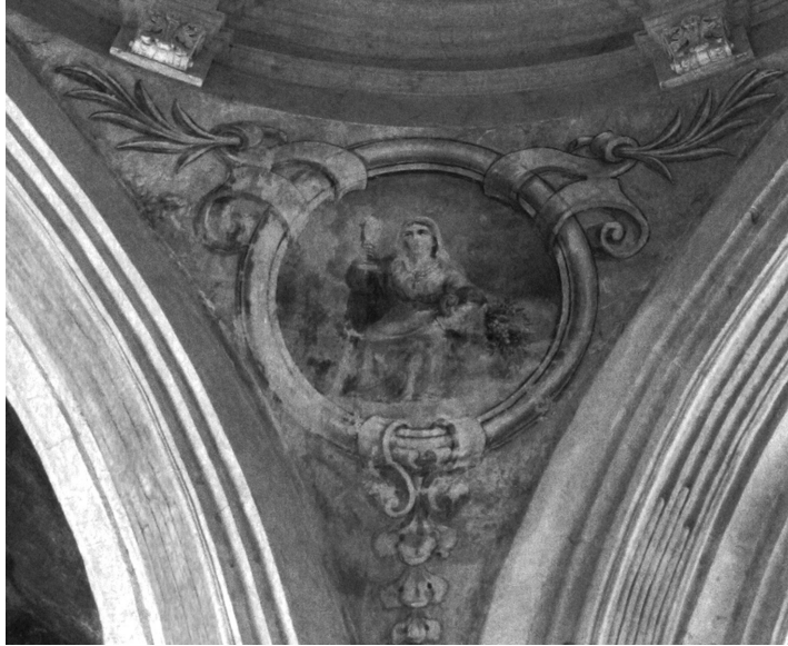
Fig. 1 Bones obres