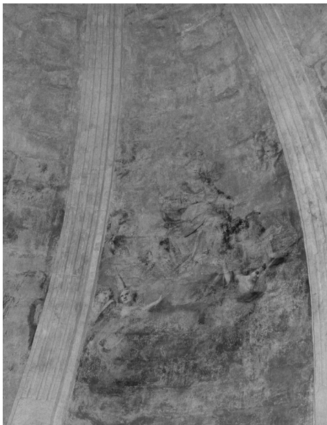
Fig. 5 Plafó Reina