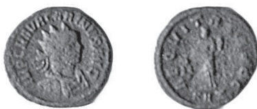
Marcus Aurelius Carinus

Libertas fou associada amb el pileus, habitualment portat pels esclaus liberats. Entre els romans el gorro de feltre fou l'emblema de la llibertat. Quan un esclau obtenia la seva llibertat, portava al cap rapat i enlloc de pèl un pileus sense color. D'aquí que la frase servos ad pileum vocare és una crida a la llibertat, mitjançant la qual els esclaus foren freqüentment convocats a prendre les armes amb una promesa de llibertat. Libertas també era reconeguda a l'antiga Roma per la vara, usada cerimonialment a l'acte de manumissio vindicta (llibertat per la vara). L'amo portava el seu esclau davant el magistratus, i exposava les raons (causa) de la seva pretesa manumissió. El lector del magistratus col·locava una vara (festuca) al cap de l'esclau, i ho acompanyava d'unes determinades paraules formals, amb les què declarava que era un home lliure ex Jure Quiritium, això és "vindicavit in Libertatem". L'amo, mentre tant, agafava l'esclau, i després que hagués pronunciat les paraules "hunc hominum liberum volo", donava un tomb al seu voltant i el deixava marxar, d'aquí el nom general de l'acte de manumissió. El magistratus el declarava llavors lliure.