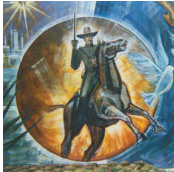
Ilustración 2. Arturo Moyers Villena, Retrato ecuestre de Felipe Ángeles , fragmento del mural del Congreso del Estado de Hidalgo.

El edificio poniente por su parte presenta en la sección izquierda un paisaje claramente hidalguense con la esquemática representación del edificio B de Tula con sus característicos atlantes, el perfil de los edificios de la industria cementera y de la transformación en el valle de Tula y la figura de Felipe Ángeles a caballo. La sección central en este caso ha sido ocupada por un campo verde sobre el que se reconocen los perfiles de varios hombres a caballo. La sección derecha presenta los retratos de los personajes más emblemáticos de la Revolución Mexicana: Madero, Carranza, Villa y Zapata.