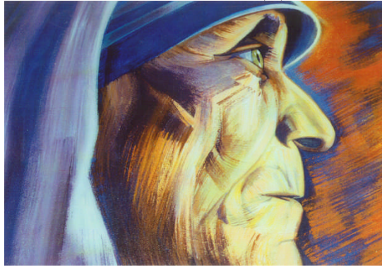
Ilustración 4. Arturo Moyers Villena, Teresa de Calcuta , fragmento del mural de la parroquia de Santa María, Cleveland, Texas.

En 1997, pintó el exterior de la iglesia parroquial de Santa María, correspondiente a la Liberty County Community en Cleveland, Texas. Una iglesia católica para la que proyectó a Teresa de Calcuta orando frente a Jesús. El soberbio retrato de la monja más católica —lo digo en el sentido de universal—del siglo XX, la muestra orante y de perfil. Pero lo mejor de la obra es la dinámica representación de la Trinidad. La figura del Padre mueve sus manos como ofreciendo a su Hijo, el cual de frente abre sus brazos y muestra en su pecho un disco blanco y brillante, a la vez sol y hostia consagrada. Entre el pecho del Padre y la cabeza del Hijo un blanco brillante figura la silueta de la paloma que simboliza al Espíritu. La obra se complementa con una imagen de María de Guadalupe, pintada a solicitud expresa de la comunidad mexicana del sitio y que no era parte del plan original.