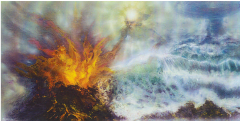
Ilustración 5. Arturo Moyers Villena, La creación , 1990. Acrílico sobre tabla, 1.22 x 2.44 m.

colores y formas, los pigmentos parece que estuvieron dotados de una vida que les hizo unirse para generar galaxias, estrellas y planetas. La figura humana del anciano sabio se mueve a la mitad de la tabla y sus manos se abren ordenando la escena. Tengo para mí que es una obra maestra que expresa lo que para Arturo Moyers es el universo: una energía vibrante.