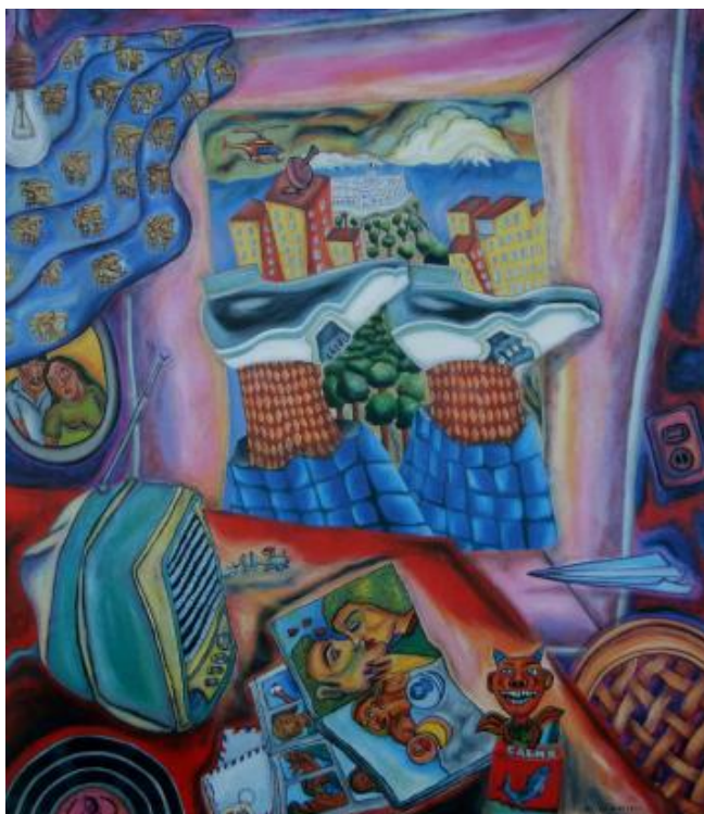
11 - "Ayúdeme Dra. Corazón", óleo sobre lienzo, 1.40 x 1.25 cm., 1988

Es la ciudad que el mundo ha volteado a ver cuando sus artistas crearon el muralismo moderno y sus escritores pusieron a hervir la lengua española con una literatura que no se conocía. La de grandes fotógrafos, músicos universales e intelectuales relevantes.