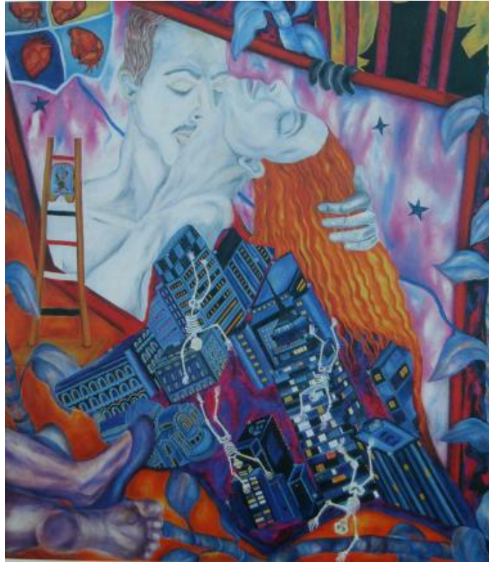
9 - "Terremoto de amor", óleo sobre lienzo, 1.40 x 1.25 cm., 1988

Siglos atrás, la ciudad fue de agua, construida sobre un lago inmenso en el que sus pobladores se desplazaban en pequeñas embarcaciones por sus calles y avenidas trazadas por canales fluviales, sobre los que se construyeron las casas, templos y palacios de los antiguos aztecas.