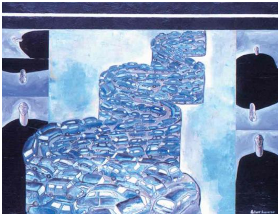
2 - "Lo cotidiano", óleo sobre lienzo, 1.40 x 1.55 cm., 2000

En sus zonas importantes económicamente, la Ciudad de México despliega hermosas avenidas arboladas, barrios residenciales con casetas de vigilancia, inaccesibles sin rigurosas identificaciones de por medio, servicios de élite en abundancia, zonas comerciales exclusivas y protección civil.