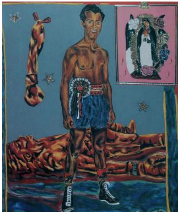
6 - "Todo se lo debo a la virgencita...", oleo sobre lienzo, 1.80 x 1.50 m , 1986

Lo mismo sucedía con otras manifestaciones como el baile de barrio o las figuras de íconos populares, cuando nosotros Los Siameses amorosamente les acogimos en nuestros temas artísticos, les dimos un lugar en nuestras expresiones de arte y los devolvimos a la cultura visual contemporánea con las luces que les agregamos.