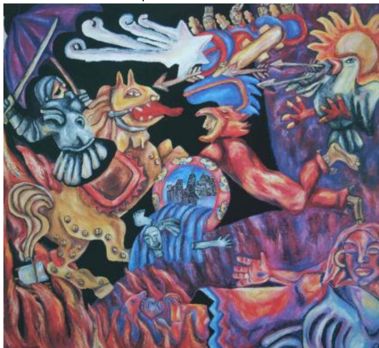
10 - "La negra armadura de la profecía", óleo sobre lienzo, 1.95 x 2.25 cm., 1990

Cuando los españoles llegaron a la ciudad en 1519, no daban crédito a la belleza y a la modernidad de Tenochtitlán, la que impresionante por su organización y limpieza, equivalía a la Venecia italiana. Su templado clima la hace disfrutable durante cualquier época del año y casi diariamente sale un sol esplendoroso que seca generosamente la ropa de los tendederos instalados en las azoteas por toda la ciudad.