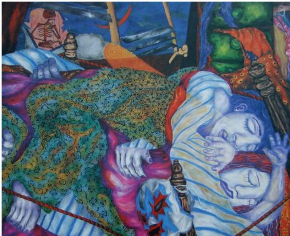
16 - "La linterna indiscreta", óleo sobre lienzo, 1.10 x 1.30 cm , 1988

Correosa, la ciudad resiste golpes letales. Selva de asfalto, jungla de cemento, de abundantes taxis conducidos por choferes agobiados. El viaje incluye noticiero radial, jerga en el respaldo, desodorante barato y vueltas prohibidas. Los desgastantes trayectos de tráfico desbordado y hacinamiento automotriz son gratis.