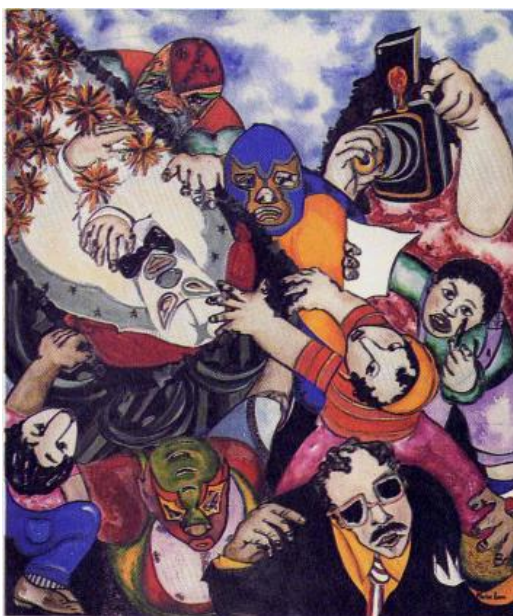
5 - "El entierro de El Santo", óleo sobre lienzo, 1.75 x 1.50 m , 1984

La lucha libre, tan popular y exitosa entre la población que emocionada asiste a las arenas para arengar a sus ídolos enmascarados, es una analogía de estas batallas cotidianas. Los enmascarados gladiadores representan a la población, son sus héroes, los ídolos del pueblo que Los Siameses hemos pintado en nuestros lienzos con devoción artística, cuando hace treinta años pocos intelectuales y artistas consideraban la cultura popular urbana un tema digno de ser tratado.