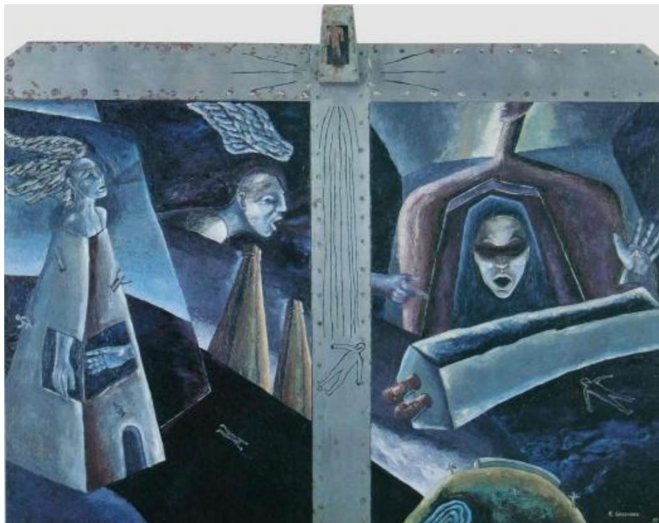
17 - "Las puertas del infierno", óleo sobre lienzo, 2.42 x 3.07 cm, 1994

Lugar de oportunidades para los artistas emergentes que duran un día, para quienes estudiaron arte y tienen títulos que lo comprueban aunque no sean artistas, para quienes se dicen artistas porque se les ocurrió que podrían volverse famosos y para aquellos artistas extranjeros que en sus propios países nadie conoce y también para los que son internacionalmente laureados.