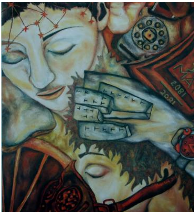
4 - "Humo en los ojos", óleo sobre lienzo, 2.15 x 1.95 cm, 1990

Una ciudad que con todo y el consumo de sus millones de habitantes - casi veinticinco incluyendo a la periferia - se mantiene ordenada y limpia, circulable. ¿No es acaso una proeza civilizatoria lograr la convivencia cotidiana de tal cantidad de gente que aborda el metro organizadamente, o de tal cantidad de autos que circulan sin atropellar en cada esquina a los peatones ? ¿No es acaso una proeza atravesar la extensa geografía de asfalto para llegar al trabajo luego de una jornada de diez horas, más tres horas de traslado promedio, para ganar un sueldo que apenas alcanza para comer ? La vida palpita en las entrañas del monstruo. La gente lucha por vivir mejor. Nuestra ciudad, la de Los Siameses , vive intensamente.