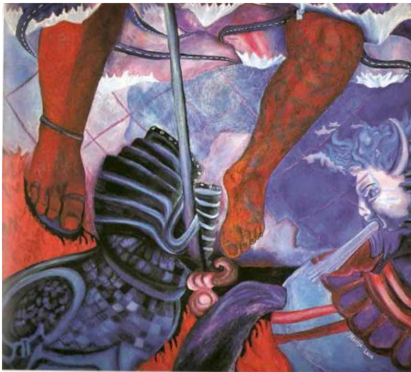
12 - "Motel La Conquista", óleo sobre lienzo, 2.25 x 1.95 cm., 1990

A pesar de la inmensidad de los problemas, la gente ama, se enamora, hace fiestas, consume desafortadamente, se moderniza, utiliza alta tecnología, vive y hace planes. Somos un pueblo que no se rinde aunque baile con la muerte. Y esto no dicho metafóricamente, en alusión a la tradición del Día de Muertos, sino porque la muerte acecha impunemente en manos del crimen organizado, hoy cáncer en la sociedad mexicana.