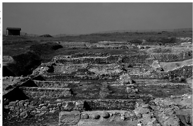
Lancia. El macellum (mercado) y las termas en segundo plano.

Su ubicación explica la elección de este cerro por su fácil defensa, al encontrarse elevado sobre las llanuras aluviales de los