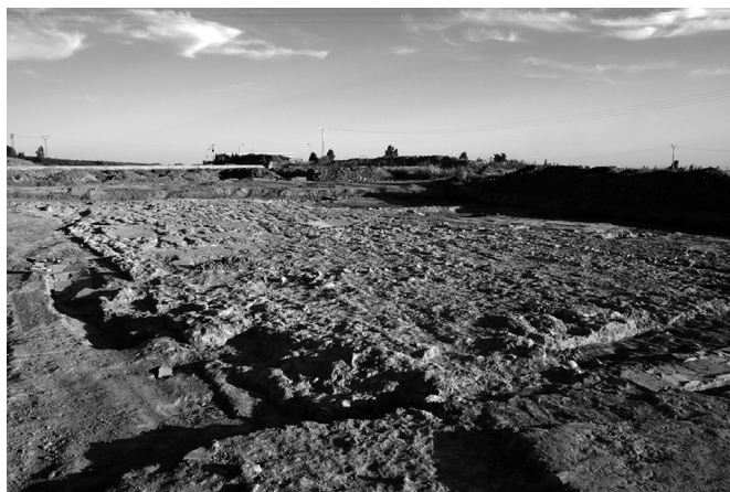
Restos del edificio sobre el terreno tras su excavación en 2010.

valles de los ríos Esla y Porma, cuya fertilidad constituía la base de la economía agropecuaria de la ciudad. Su superficie es llana, pero con una prolongada inclinación desde el noroeste al suroeste. Se encuentra a 840 metros de altura media sobre el nivel del mar.