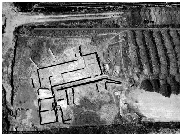
Foto aérea de la mutatio o mansio de Lancia con las marcas más importantes del edificio y de las fases funcionales y constructivas del mismo.