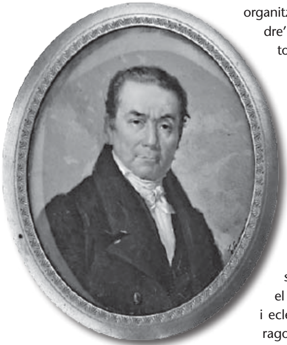
Retrat de Marià Flaquer i Lluch.

- Marià Flaquer i Lluch (1766-1841) i el seu fill eren negociants. El 1821 organitzaren una expedició a Madagascar per capturar esclaus i vendre'ls al continent americà, amb força èxit. Per recomanació d'Antoni Puig, van anar comprant casa i terres al terme del Pedrís, que portava Jaume Giné, de Linyola, que feia de mitger. Les relacions personals entre Puig i Flaquer van patir força per un préstec de 33.000 lliures que Puig no pogué retornar puntualment.