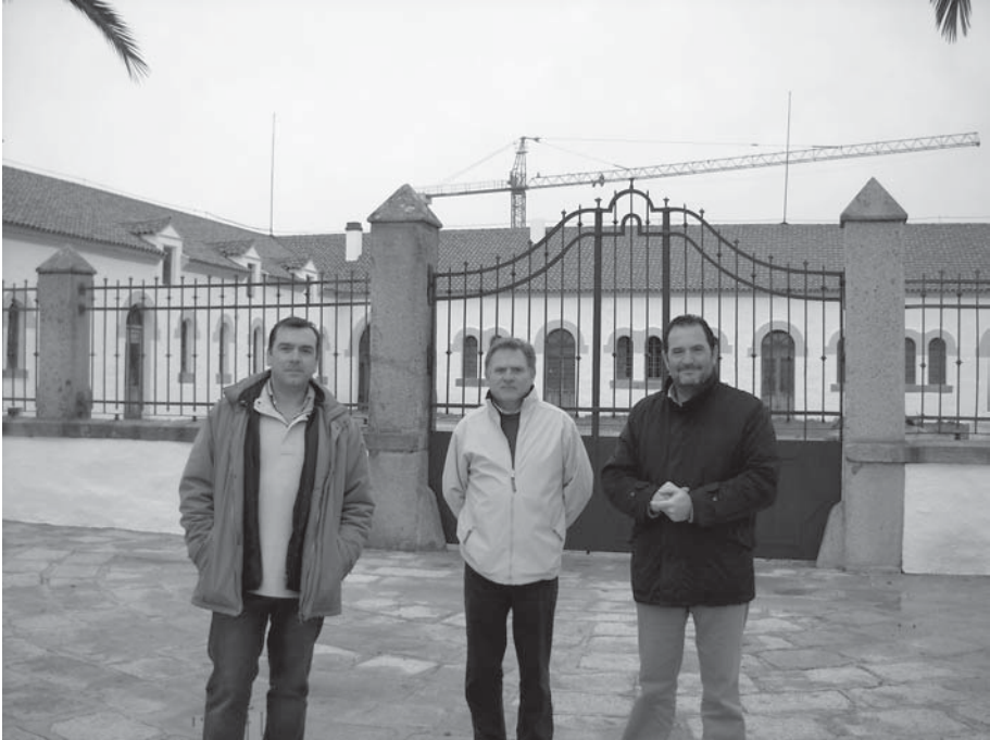
Con miembros de Piedra y Cal ante "La Salchi"

comarca, sino que además permite la conservación integral de un edificio muy representativo.