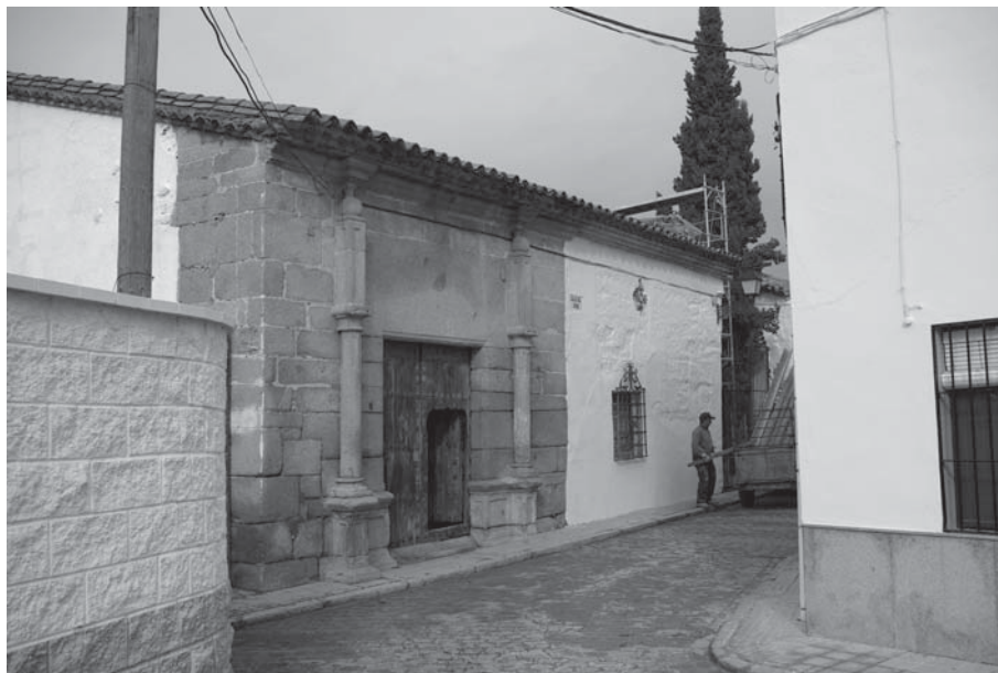
Fachada de la Posada del Moro

Durante el año 2010, el Museo PRASA Torrecampo ha seguido contando con dos instalaciones propias: el almacén temporal, en el que no se han producido novedades dignas de ser reseñadas, y el antiguo edificio de la Posada del Moro, junto a los solares anejos destinados a la construcción del edificio para ampliación del museo, donde se ha actuado para solucionar las carencias observadas y comenzar la rehabilitación comple-