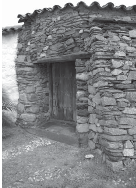
Rehabilitación de muros

Durante el año 2010 no se han producido cambios en el programa de conservación de las colecciones desarrollado en nuestro museo. No se han realizado trabajos directos sobre ninguna pieza, y únicamente se han controlado las condiciones de conservación manteniendo un programa de conservación preventiva que ya se