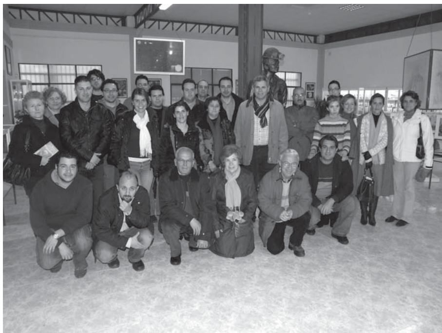
Fotografía 4: Grupo asistente a la conferencia de la Pieza del Mes

En el mes de Mayo, en el programa “Destino Andalucía” de Canal Sur, el Director del Museo fue entrevistado y se emitió al mismo tiempo un breve documental sobre el Museo.