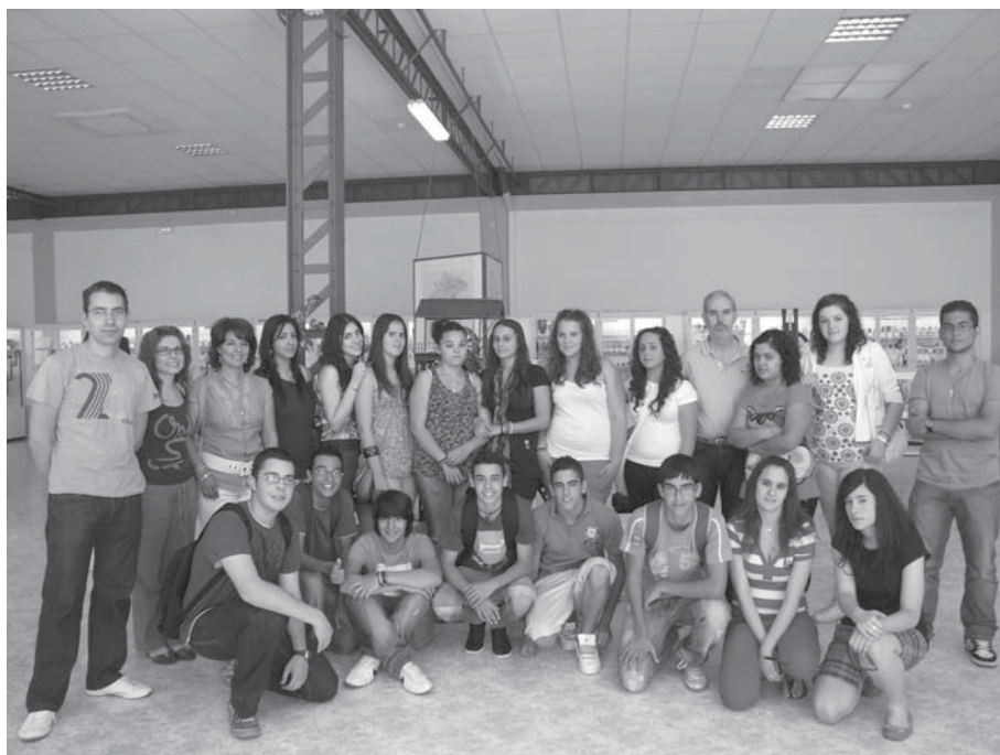
Fotografía 1: I.E.S. "Florencio Pintado" de Peñarroya-Pueblonuevo