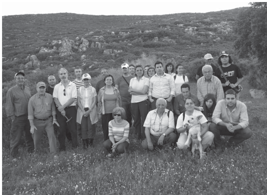
Fotografía 2: Participantes en el itinerario geológico. Sierra de Espiel