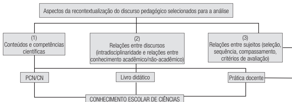
Figura 1 – Fontes e características pedagógicas a serem analisadas

A figura 1 permite identificar as três instâncias de recontextualização e as características pedagógicas escolhidas para buscar as respostas às questões relativas ao nível conceitual do conhecimento escolar de ciências: