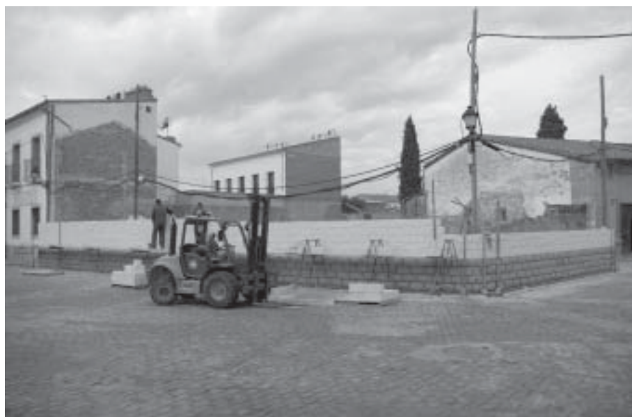
Construcción del muro de obra para el nuevo cerramiento del solar destinado al edificio de ampliación

Las fuertes lluvias que se han mantenido desde mediados del mes