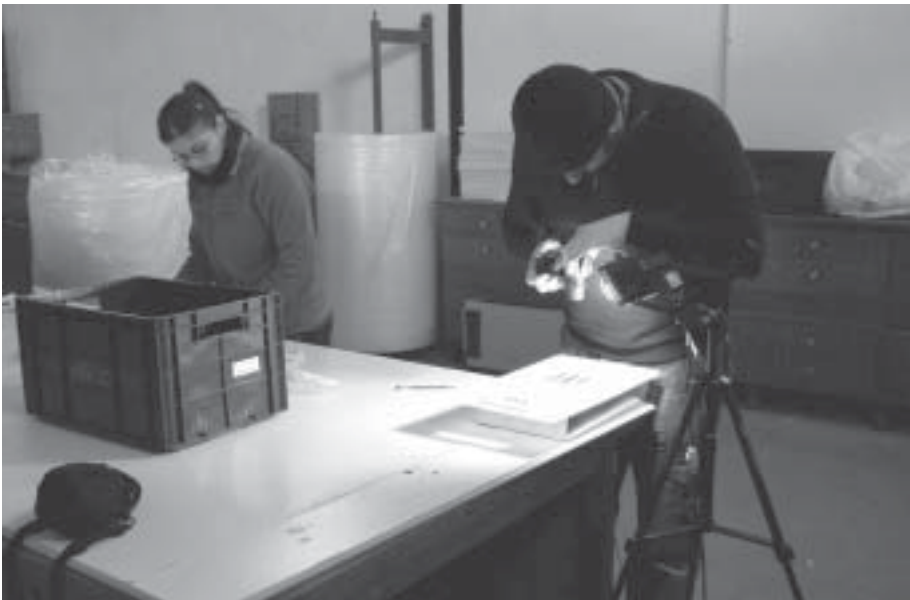
Investigadores revisando materiales en el área de trabajo del almacén temporal