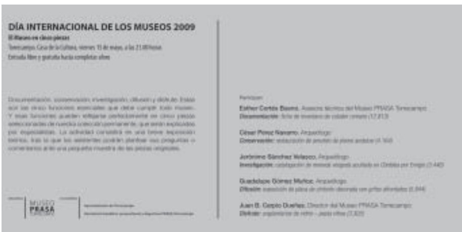
Invitación a la actividad programada con motivo del Día Internacional de los Museos