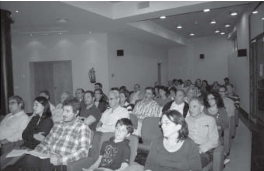
Vista parcial del público asistente a la actividad