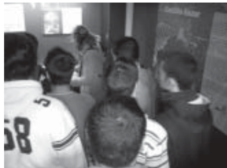
Visita de colegios

3º.- Se aprecia un aumento de las visitas, que tienen conocimiento a través de Internet y aumenta el número de visitantes procedentes de diversas poblaciones de la comunidad autónoma, que llevan a cabo visitas de fin de semana a la localidad, para conocer su Patrimonio; de éste resalta la visita a la “villa” romana de Fuente Álamo.