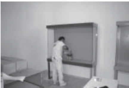
Sala Etnografía: pintado vitrinas y sala terminada