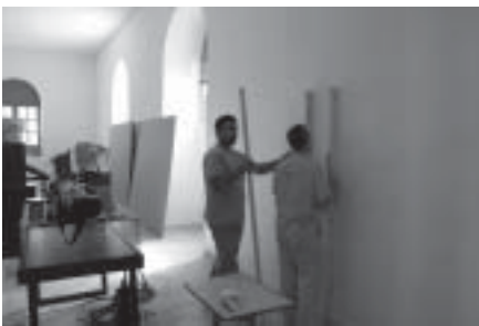
Preparación pared y colocación de paneles DM

Estos trabajos se han sufragado con una subvención por importe de 18.603 € de la Consejería de Cultura de la Junta de Andalucía, dentro del programa de mejoras de dotación de museos y se han realizado durante los meses de julio y agosto de 2009.