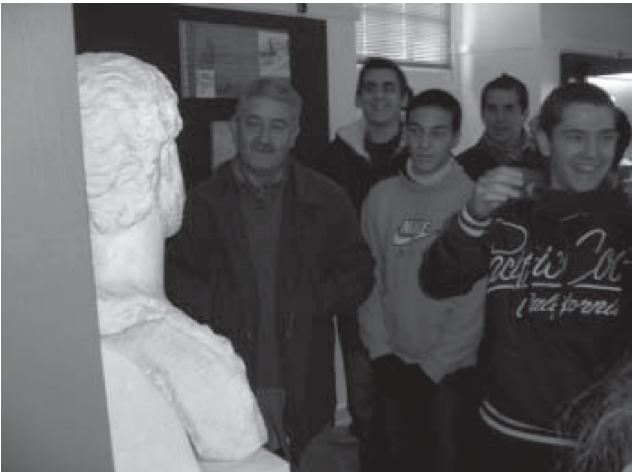
Actividades: visitas guiadas a centros de ESO y BUP

Recuperación de procesos artesanales de elaboración de la carne de membrillo.