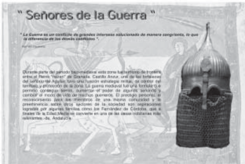
Panel de cartelería de Sala III: Edad Media

Por último resaltar, que el museo mantiene una estrecha colaboración con los otros museos de forma muy especial con los de la provincia de Córdoba, a través de la Asociación Provincial de Museos locales de Córdoba y a nivel institucional con la Delegación Provincial de Cultura de Córdoba y el Área de Cultura de la Diputación Provincial.