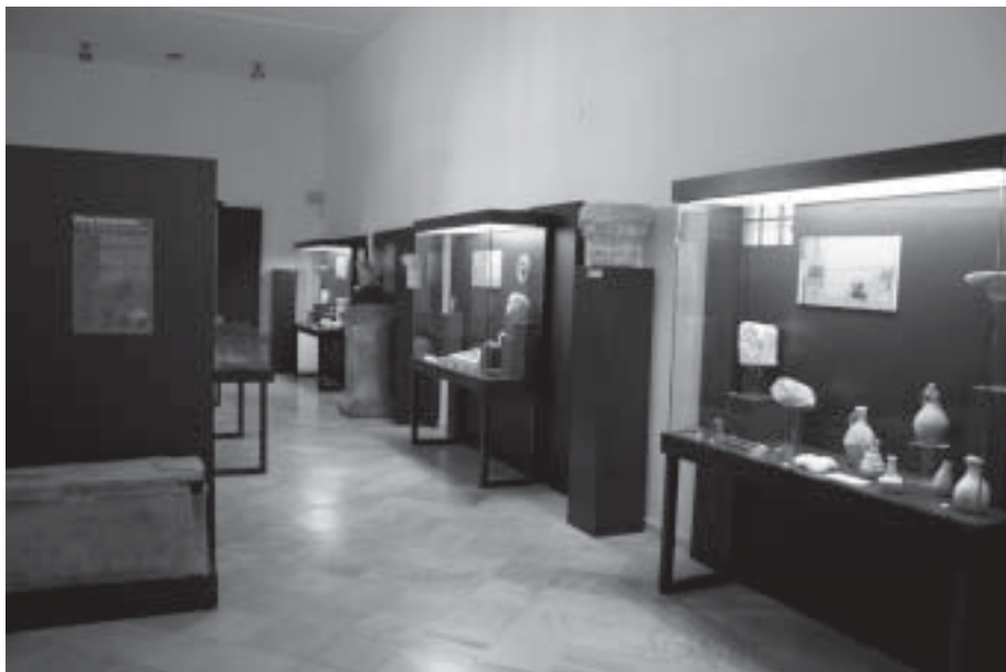
Sala II. Edad Antigua

Entre los acontecimientos más relevantes de orden externo y en rela-