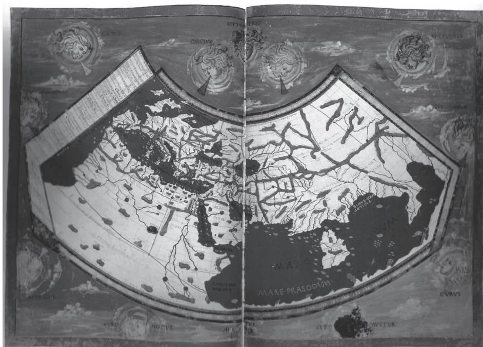
Figura 1: Mapamundi renacentista realizado de acuerdo a la primera proyección de Ptolomeo.

Ptolomeo describió con sumo cuidado el trazo de las líneas necesarias para que se pudieran indicar de manera clara y sencilla la posición de los lugares a representar. Ya en Ptolomeo la representación del mundo quedaba sujeta a la geometrización del espacio, a los progresos de la geometría descriptiva y sus virtudes para cautivar la mirada del observador. En este primer modelo para la imagen del mundo el mapa constituye un medio instrumental a través del cual transmitir, incluso subsanar mediante coherencia matemática, una explicación narrativa, la explicación geográfica del mundo habitado [PORTUONDO, 2005, p. 25].