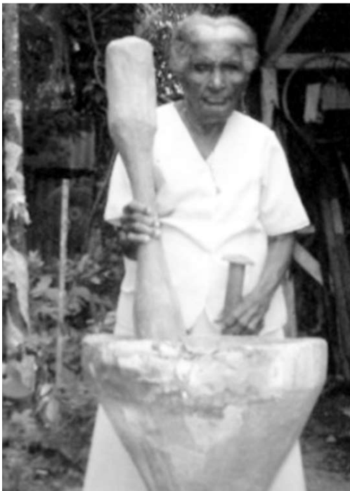
Estudiantes IENSSUR, Turbo, 2009.

Las carrozas, comparsas de danzas folclóricas y los disfraces también hacen parte del festejo novembrino turbeño. Desde junio, los organizadores ponen todo su empeño para que las candidatas tengan carrozas realizadas por artesanos turbeños que año tras año ponen en juego su imaginación. Habitantes de barrios como La Lucila, Hoover Quintero, Manuela Beltrán, San Martín, Obrero, Chucunate, entre otros, se disponen a competir junto con sus representante por los mejores vestidos, disfraces y comparsas. Las comparsas de la Casa de la Cultura y de las escuelas oficiales de Turbo también acompañan el cortejo al ritmo de cumbias, mapalés y contradanzas que se pasean por los espacios públicos de Turbo como son el estadio municipal José