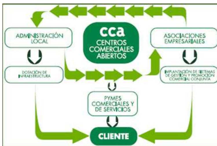
Gráfico 2. La Estructura de los Centros Comerciales Abiertos

Para medir la capacidad del centro comercial abierto de Maracena hemos realizado la tabulación de los 34 criterios señalados por la Junta de Andalucía y los hemos presentado en un auto cuestionario para su eventual evaluación.