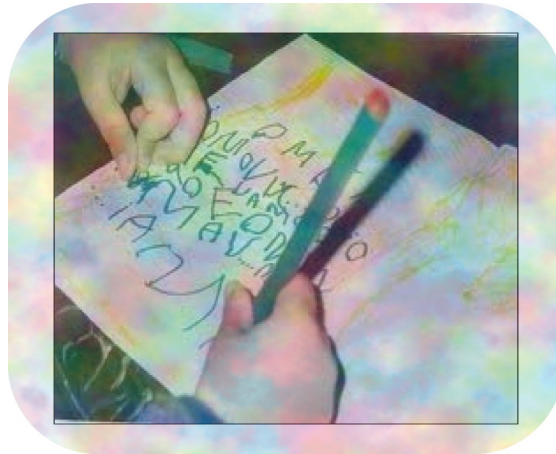
Imagen 6. ¿Escritura pegada o despegada, esa es la pregunta?