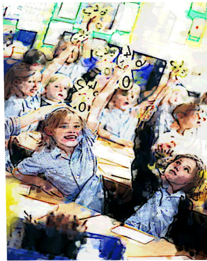
Imagen 5. Brazos levantados, no por rebelión; si no para ser autorizados a responder.

Sé asignaba un texto escolar para la materia y debíamos aprenderlo “al pié de la letra” h , la memoria era indispensable. Eran los días del método mutuo o de Lancaster o método inglés: férrea disciplina y premio y castigo. Este sostenía que los alumnos van a la escuela a adiestrarse y a aprender, a repetir lo que la jerarquía –que era el profesor- enseñaba. No se hablaba sin permiso, que se obtiene levantando el brazo y el profesor señalaba quien “tenía la palabra” y solo así estaba autorizado para contestar.