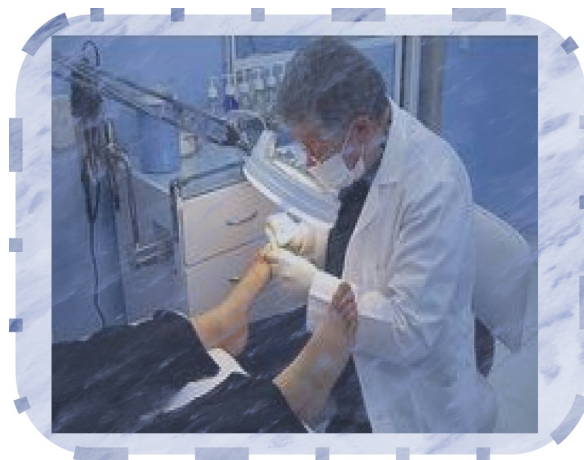
Imagen 4. Uña encarnada (Onicocriptosis)-Onicectomía.

A manera de moraleja se puede decir: No se sabe si de manera arbitraria o por imposición o por esnobismo o por ignorancia o por todas las anteriores premisas y, otras más, se viene desechando, estigmatizando y ridiculizando esos “tradicionales saberes” sin garantizar de antemano que los nuevos métodos son efectivos.