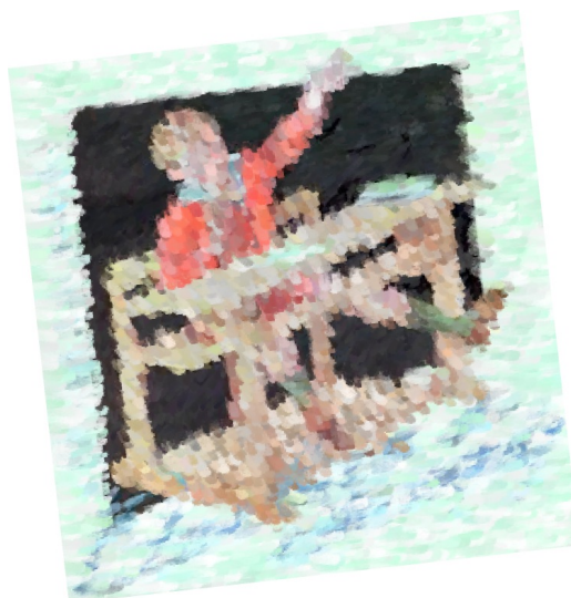
Imagen 2. Scriverio Madera y “un amigo fiel”.

Eventualmente mientras “mis amigos fieles” se desplazaban camino al colegio, se cruzaban con él cuando primero en su bicicleta, después en su moto y finalmente en carros de diferentes modelos se detenía unos minutos para animarlos a seguir y no desfallecer en sus estudios. Desapareció un tiempo indeterminado y, cuando regresó ahora sí “muy maduro”, elegante, portentoso, serio, adinerado, voluptuoso, sano, envidiado, rico, bilingüe y muy bien ataviado.