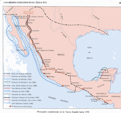
Mapa N° 3: reinos de la Corona Española.

largo plazo que garantiza la seguridad jurídica de las inversiones españolas 11 .