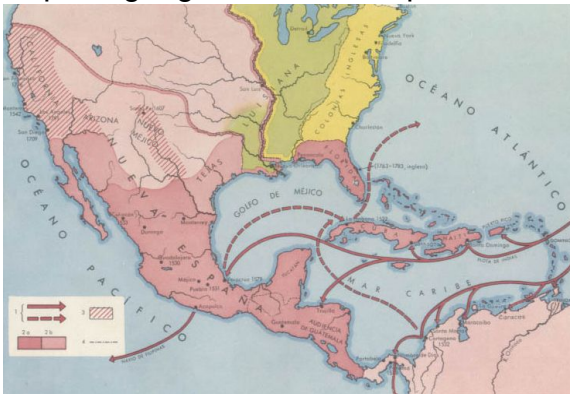
Mapa 1: geografía Nueva España.