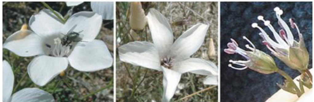
Fotografías 4-6 Flores de Linum suffruticosum (Lino blanco). Nótese las posiciones reciprocas (en tres dimensiones) de anteras y estigmas en los dos morfos. (a) El morfo pin (de estilos largos, por encima de estambres), con mosca del género Usia (Bombyliidae) en su camino hacia dentro de la flor en búsqueda de polen, contactando con las anteras con su superficie ventral, y con los estigmas con la parte dorsal del tórax, el cual está cargado con polen del morfo thrum (de estilos por debajo de los estambres) recíproco. (b) El morfo thrum (de estilos cortos), con mosca Usia sp. en la base de la corola tomando néctar. (c) Los dos morfos comparados, sin los pétalos. (Fotografías de Ambruster et al. , 2006).

Recientemente se ha visto que las plantas heterostilas no muestran una reciprocidad perfecta de los órganos sexuales (Pérez et al. , 2004, Pérez-Barrales et al. , 2006; Sánchez et al. , 2008; Ferrero et al. , 2009). También se ha encontrado, en Linum suffruticosum L. (Lino blanco) de la península ibérica, la presencia de un nuevo tipo de heterostilia, llamada reciprocidad tridimensional, debido a que esta reciprocidad ocurre en altura de estambres y estigmas, en su disposición interna y externa respecto al eje vertical floral, y en la torsión hacia dentro o fuera de anteras y estigmas (Armbruster et al. , 2006) como se aprecia en la fotografías 4-6. Estos autores señalan que tal disposición mejora la transferencia legítima (entre morfos) de polen, en detrimento de la ilegítima (dentro de morfos, dentro de la flor). Por tanto representa un apoyo a ciertas hipótesis sobre la evolución de la heterostilia en las que esta promoción de la transferencia legítima es el factor clave (Lloyd et al. , 1992), como ya propuso Darwin (1877). De hecho, esta heterostilia tridimensional aparece de forma terminal en una filogenia muy preliminar de algunas especies de Linum (Armbruster et al. , 2006). Sin embargo, no se sabe si hay casos intermedios en esta evolución o una vez alcanzada ésta heterostilia, si es estable, es decir, si ha habido reversión o no de la condición floral a lo largo de la evolución.