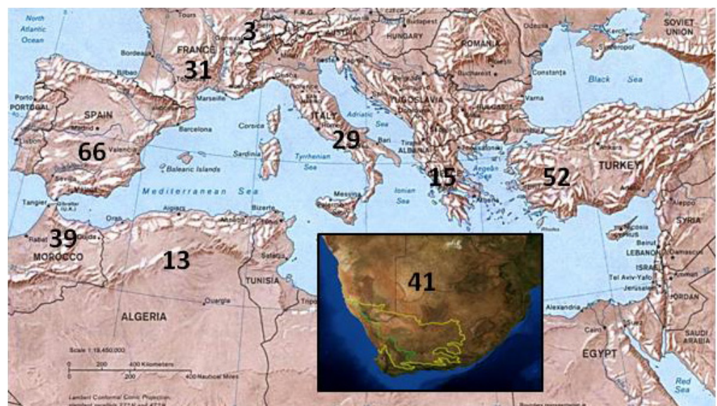
Fig. 3 Número de poblaciones del género Linum colectadas en cada lugar de muestreo, tanto en la cuenca del mediterráneo como en Sudáfrica. Un total de 190 poblaciones de unas 65 especies del género Linum .

Además mucha información ha sido proporcionada por diversos herbarios, los cuales fueron visitados durante los años 2009-2011, antes de realizar los diferentes trabajos de campo. Entre ellos destacar la inestimable colaboración de los herbarios del Real Jardín