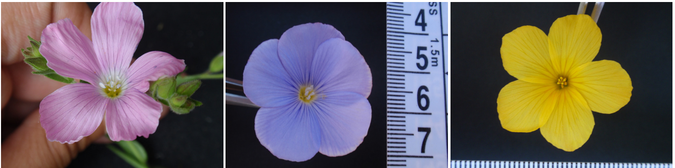
Fotografías 1-3: Linum viscosum Desf.; Linum narbonense L.; Linum campanulatum L.

Otros representantes de la Península Ibérica son estos (fotografías 1-3):