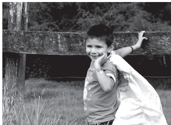
Niño vereda El Rosal Cundinamarca. Proyecto Relatos de niños. De cómo las vivencias se vuelven palabra.2011

Si los niños no encuentran a su alrededor protección afectiva y lugares para expresarse, pueden interpretar sus vivencias traumáticas como letanías, se vuelven prisioneros de su memoria, pero si le damos la palabra, el lápiz o el ambiente