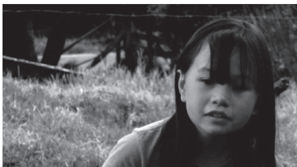
Niños vereda El Rosal. Proyecto Relatos de niños de cómo las vivencias se vuelven palabra. 2011

momento, de manera activa al otro. Esta dinámica aparece entonces como un encadenamiento de procesos bidireccionales que evocan el modelo de un espiral que se ha denominado modelo transaccional. Esta imagen de espiral indica que, con el tiempo, los procesos de interacción evolucionan, enriqueciendo la vida psíquica del niño.