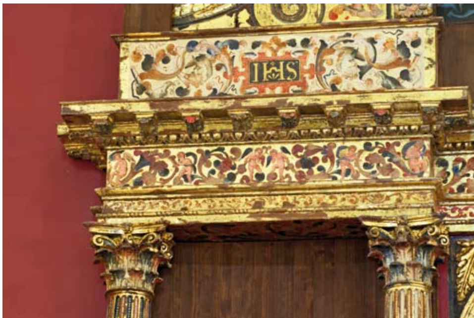
Vista de la rica decoración en el segundo entablamento y aletas.