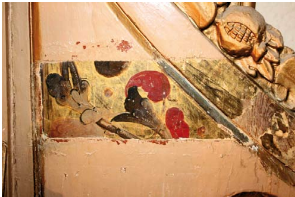
Detalle del proceso de limpieza en una de las aletas.