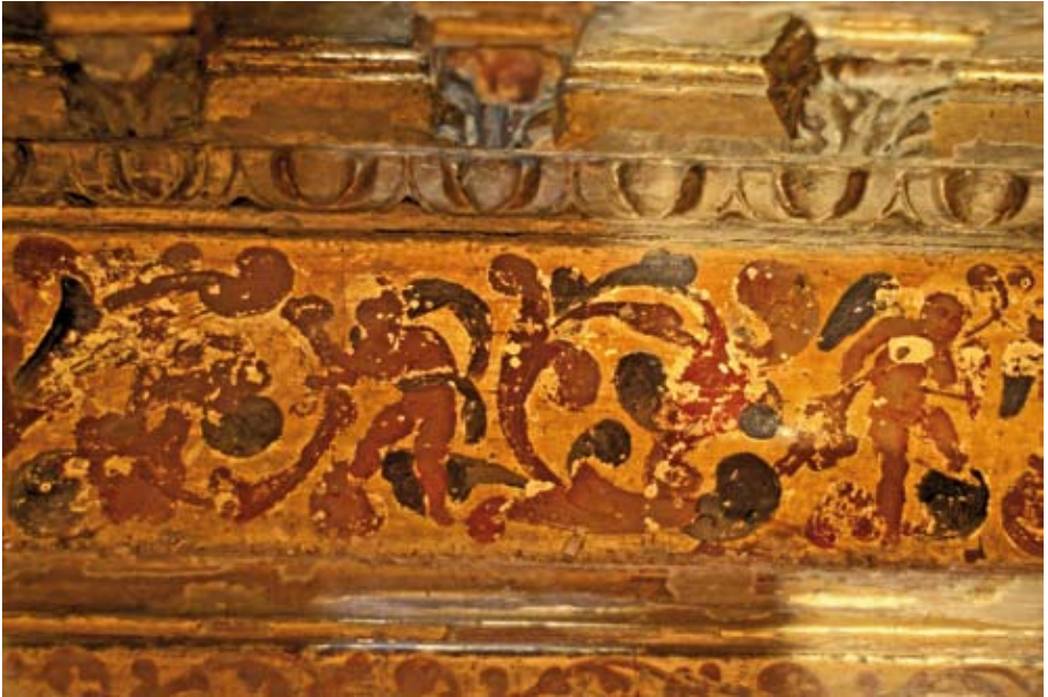
Detalle de angelitos antes de la restauración.