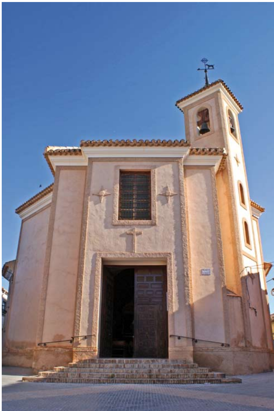
Fachada principal de la iglesia de San Roque.