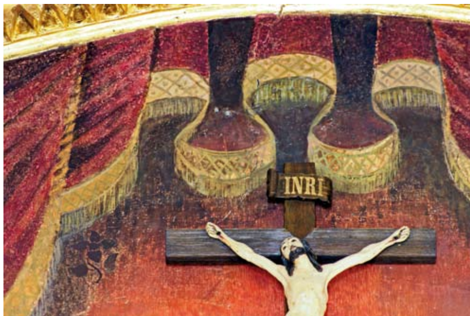
Frescos una vez intervenidos.