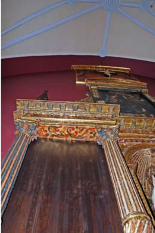
Detalle de las planchas de madera añadidas en las calles laterales.