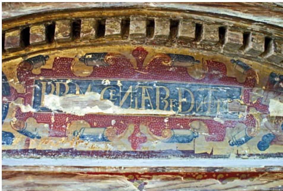
Inscripción del “Primogenita Redentoris” antes de su restauración.