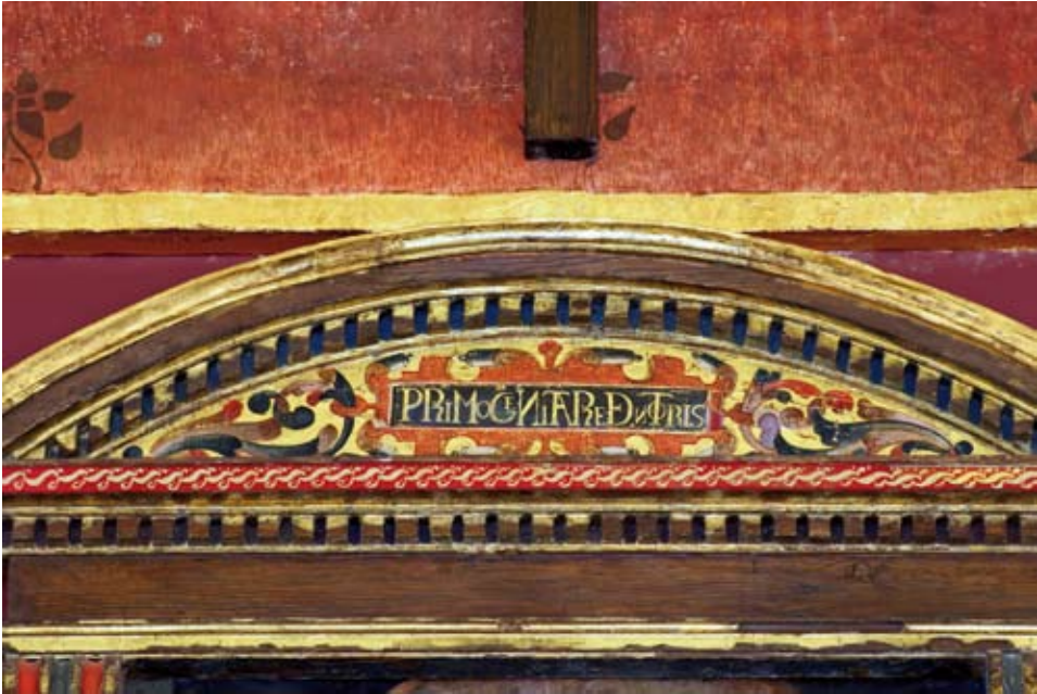
Estado del remate del frontón e inscripción después de la restauración.