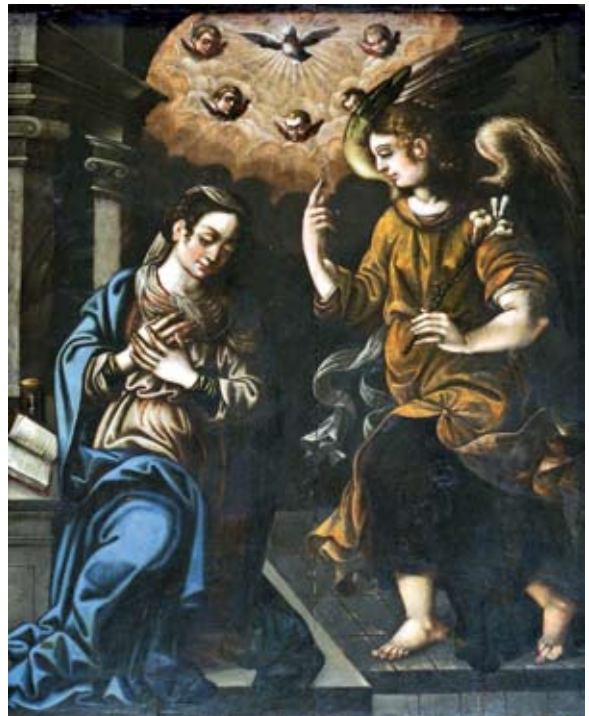
Tabla de la Anunciación.