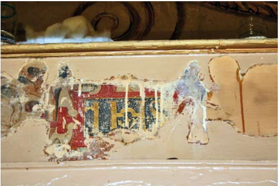
Levantamiento de repintes.