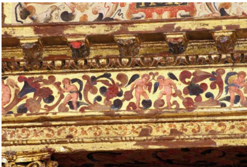
Detalle del frontón con decoración de ángeles.