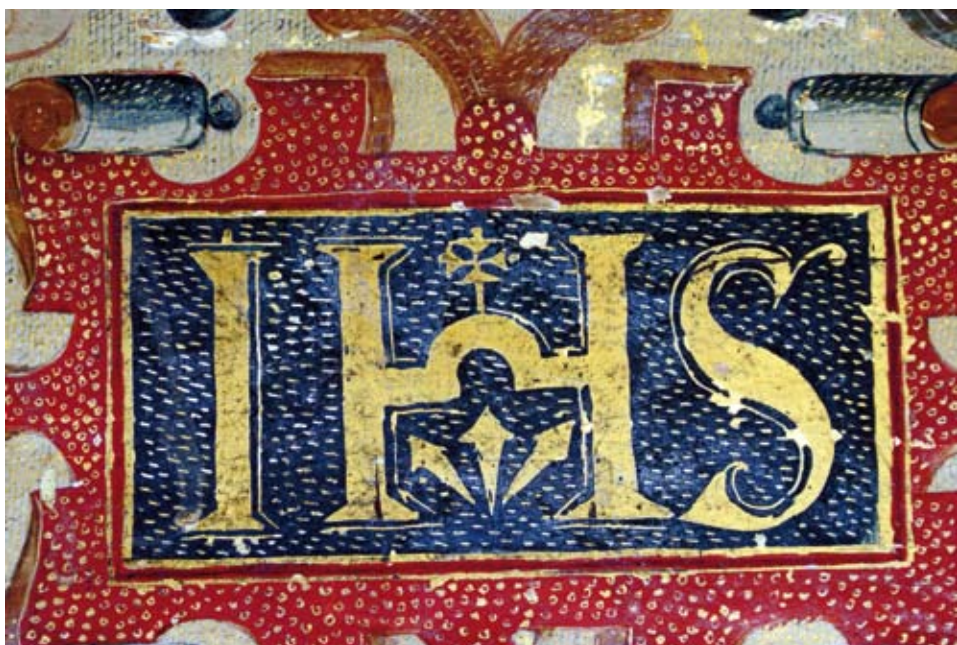
Monograma del nombre de Jesucristo.