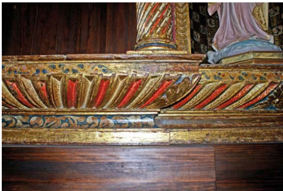
Unión de la predela actual con el primer entablamento.