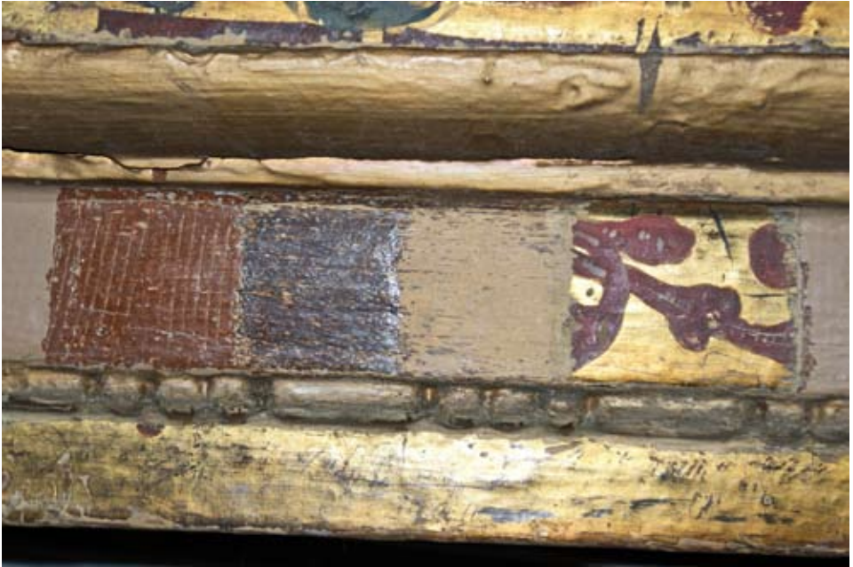
Imagen donde se aprecian las distintas capas de repintes.