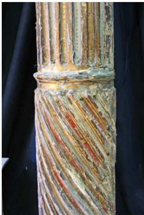
Detalle de uno de los fustes antes de su restauración.