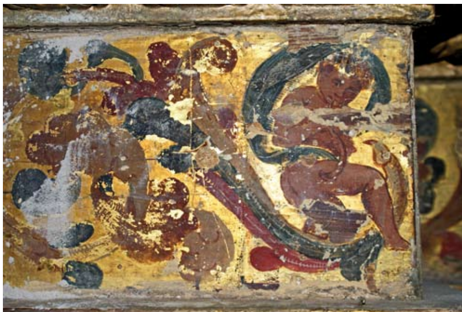
Uno de los ángeles antes de ser intervenido.