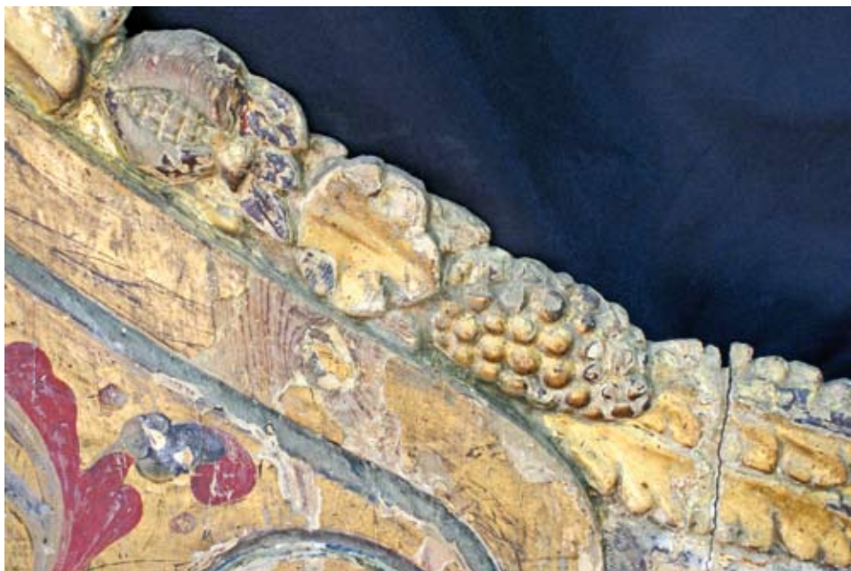
Detalle de una de las cenefas de frutas de las aletas.