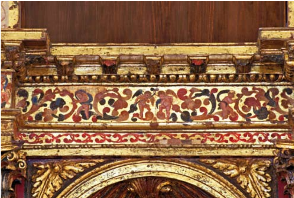
Parte central del entablamento de los ángeles.