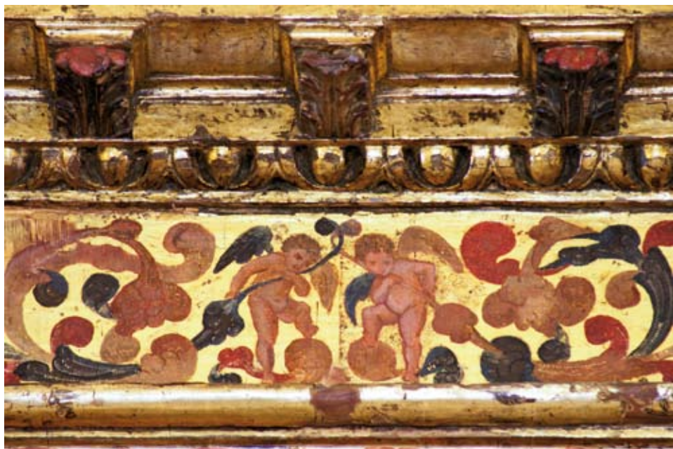
Angelitos en detalle tras su restauración.