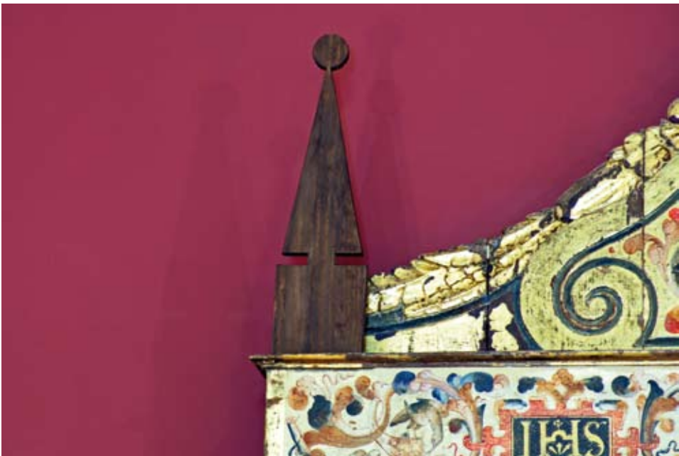
Detalle de uno de los pináculos añadidos.