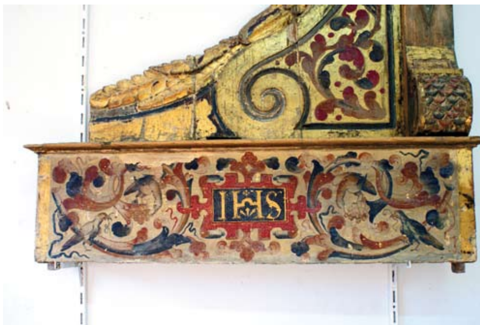
Detalles de la decoración de una de las aletas.