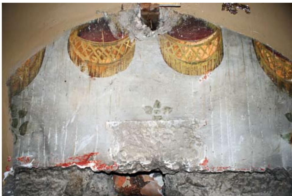
Estado de los frescos al retirar el frontón del ático.