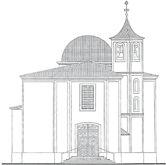
Alzado de San Roque.