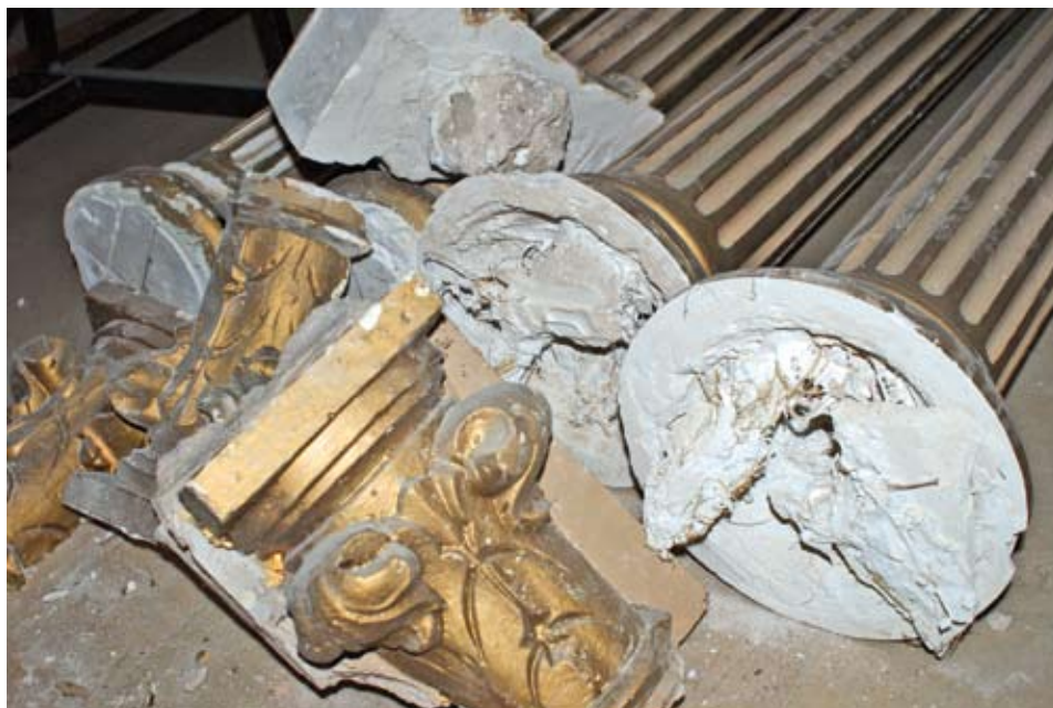
Columnas y capiteles realizados en escayola procedentes de la predela.