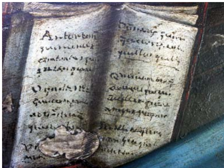
Detalle del libro perteneciente a la tabla de la Anunciación.