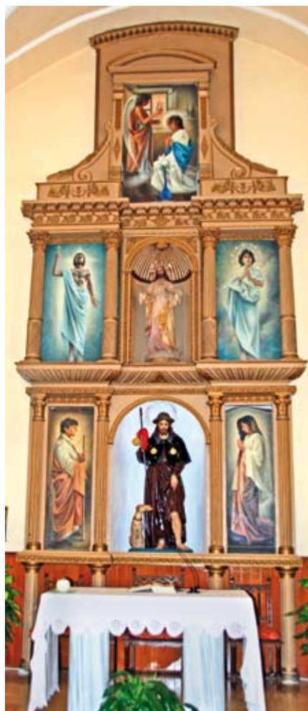
El retablo antes de la intervención.