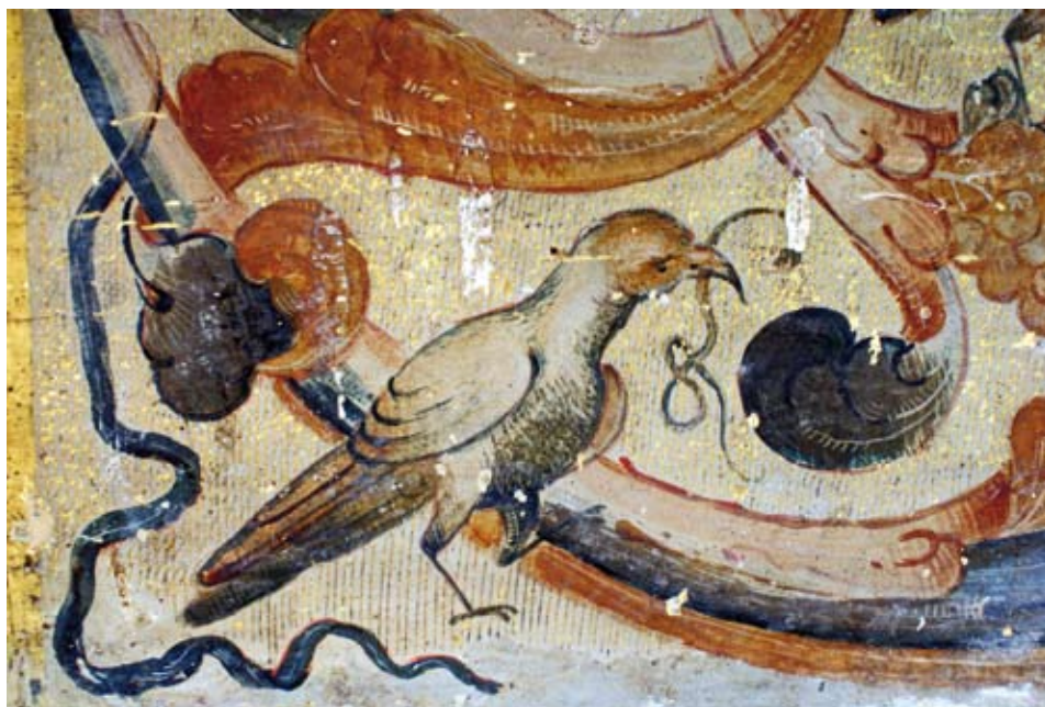
Detalle de una tórtola.