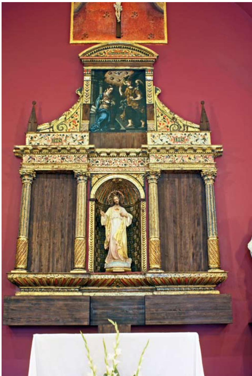
El retablo tras la intervención.