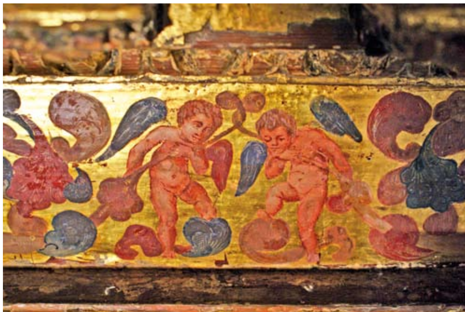
Detalle de dos angelitos tras la restauración.