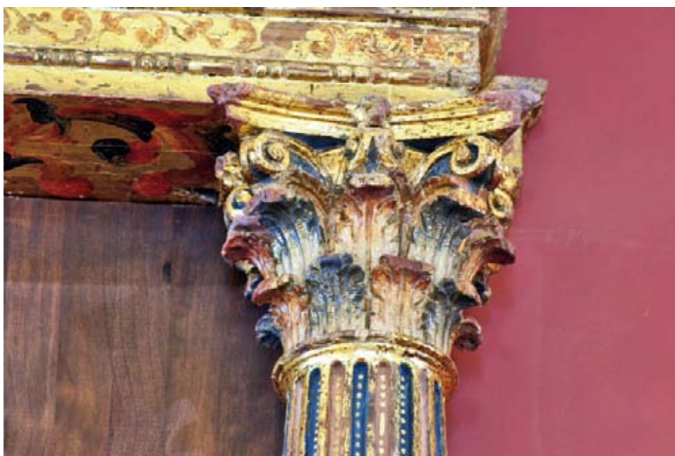
Detalle de capitel y entablamento.