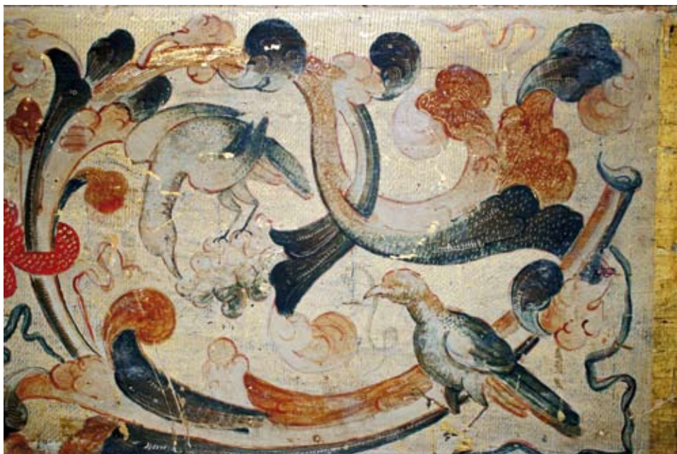
Detalle de las tórtolas.