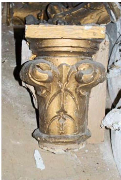
Capitel de escayola.