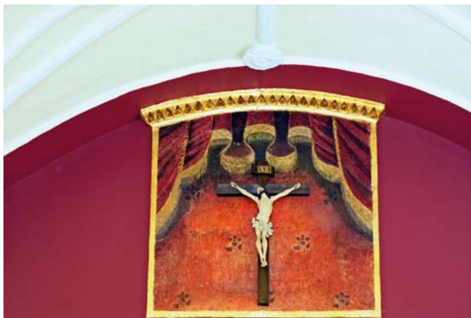
Estado actual de los frescos ocultos bajo el remate del retablo antes de su restauración.