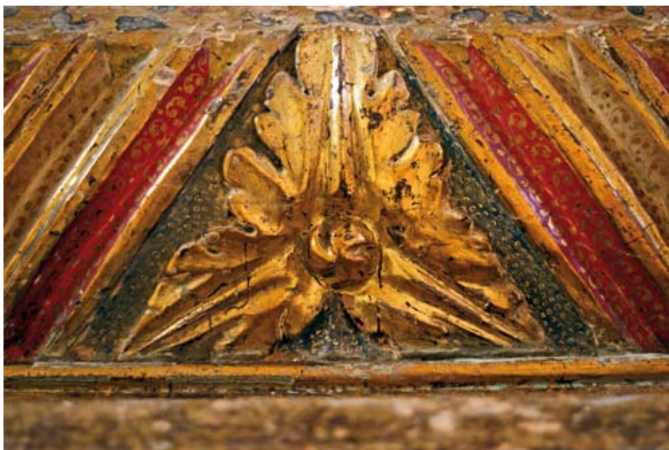
Detalle de uno de los numerosos bajorrelieves de motivos florales que adornan el retablo.