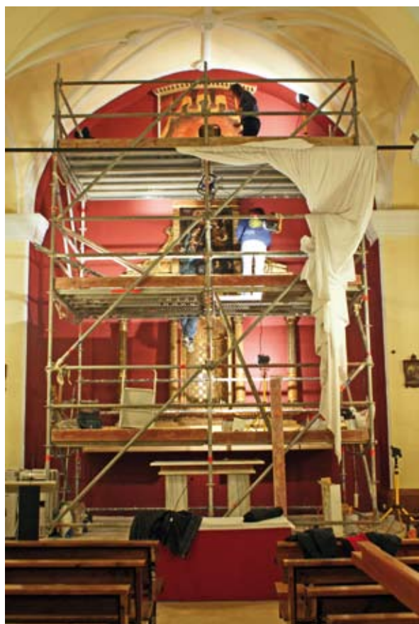
Vista de los trabajos realizados durante la restauración.