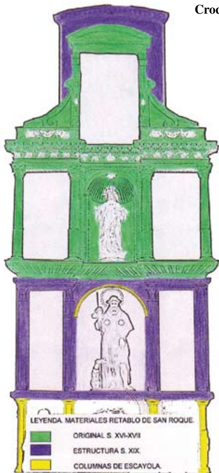
Croquis del retablo antes de su intervención.