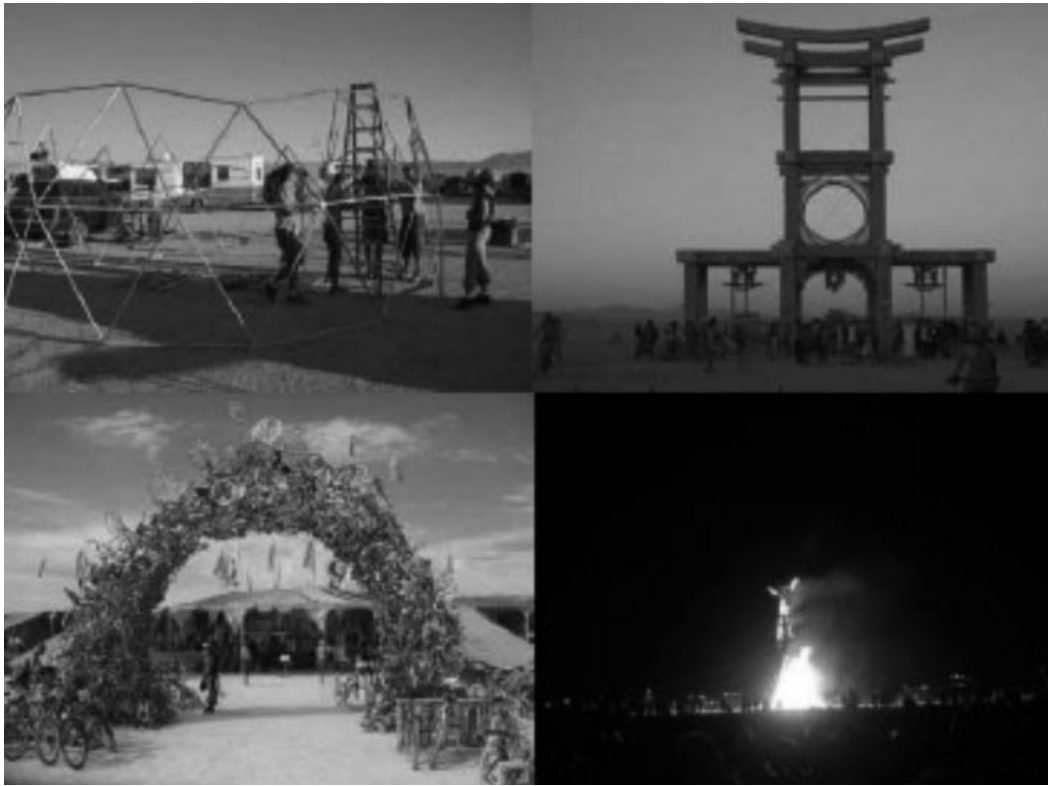
4 MAZZOLENI, I., READ, M., ZANCAN, R., "DO AND UNDO", E.U.A, 2007

ciudad planificada, habitantes deslocalizados llevando su casa y sus sueños junto consigo, espacios efímeros llenos de nuevas formas de hábitat en los cuales podemos reconocer antiguas alternativas de vida que escapan de las mesas de dibujo demasiado ocupadas de un entorno cada vez más inhóspito.