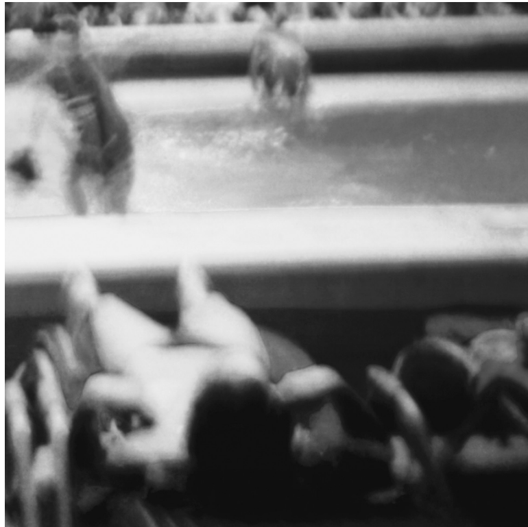
Serie 37°, 2011