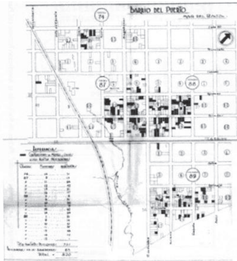
Mapa 4 Plano del "Censo de pescadores que viven en el Puerto"