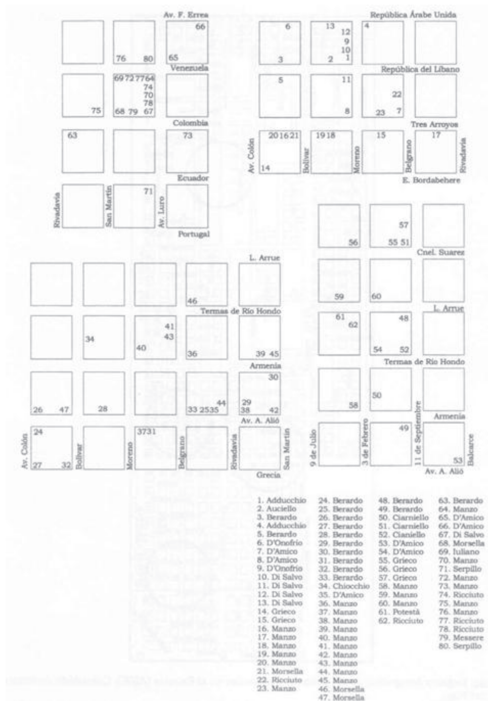
Mapa 8 Pautas residenciales de los oriundos de Duronia en los Barrios San Cayetano y El Pino, Mar del Plata, 1947-1960.

Fuente: Ibid. y entrevistas orales realizadas. Italia en Mar del Plata.