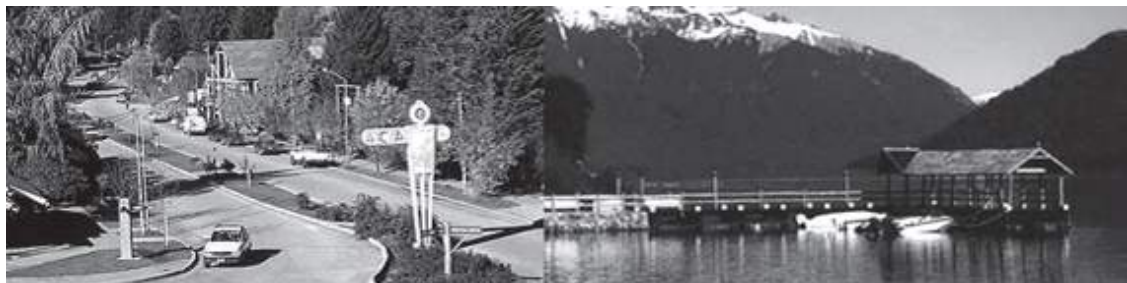
Foto 2: Vista aérea de San Martín de los Andes, Provincia de Neuquén