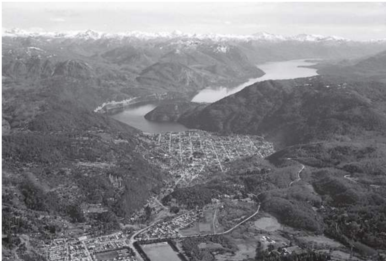
Foto 1: Vista aérea de San Martín de los Andes, Provincia de Neuquén

Villa La Angostura tal vez pueda citarse como un ejemplo paradigmático de esta crisis que pueden encontrar en los efectos de los procesos de migración de amenidad una de sus causas principales. La actividad turística, considerada el motor de la economía de la Villa, está experimentado síntomas de decrecimiento en muchos de sus indicadores. Se presenta la paradoja de que en un escenario de aumento sostenido de la cantidad de visitantes y de la cantidad de pernoctes registrados en el destino, se da una disminución progresiva en los porcentajes de ocupación de los establecimientos hoteleros y extra hoteleros que incide en la caída en la rentabilidad de negocio turístico. La tradicional estacionalidad que sufren estos destinos viene a sumarse a toda esta situación para complicar aún más el panorama (Foto 1 y Foto 2).