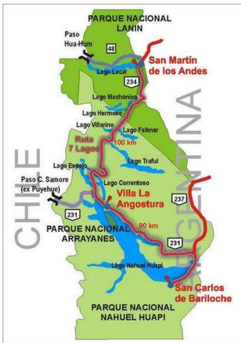
Mapa 1: Corredor de los Lagos, Argentina

Los casos seleccionados en Canadá fueron una serie de destinos de montaña de las provincias de British Columbia y Alberta donde se desarrollan procesos de migración de amenidad. En la primera etapa la investigación se basó en una revisión y profundización del conocimiento sobre migración de amenidad y competitividad sustentable de destinos de montaña (Glorioso & Moss, 2006; Stefanick, 2008; Moore et al, 2006; Moss, 2006; Ritchie y Crouch; 2003; Sheller & Urry, 2004). Esta revisión en profundidad de enfoques teóricos se combinó con una triangulación metodológica que abarco un trabajo de campo con visitas a estos destinos y la visita a académicos con experiencia en el estudio de diversos aspectos de la migración de amenidad en las Universidades de Calgary, Alberta, y Lakehead, Ontario. Los casos seleccionados en Argentina fueron San Martín de los Andes y Villa la Angostura, ambos en la Provincia de Neuquén, considerados prototípicos de desarrollos de proceso de migración de amenidad. (ver Mapa 1 y Mapa 2).