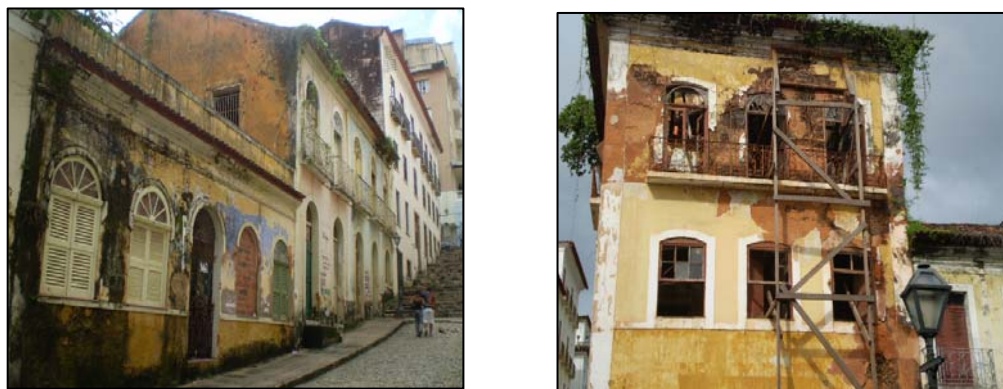
Figura 2: Caserones en ruinas y en estado de abandono

Muchos sitios están en franco proceso de deterioro y son blancos de depredación por parte de los pobladores locales; como el robo de azulejos de las fachadas de los caserones, que luego son vendidos a los visitantes; lo que representa la pérdida de importantes referentes para la memoria e identidad del barrio (Figura 2). Por otro lado, algunos caserones coloniales han sido ocupados de forma irregular por familias de segmentos sociales marginales; lo que impide el mantenimiento y la preservación del patrimonio cultural. Consecuentemente, se reducen las estrategias de promoción de la sustentabilidad temporal de estas construcciones.