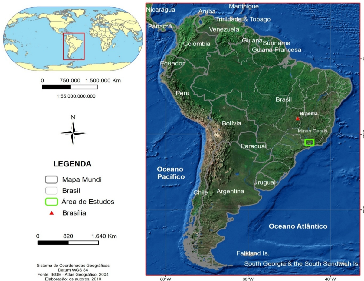
Figura 1 Localização dos circuitos analisados, Minas Gerais - Brasil