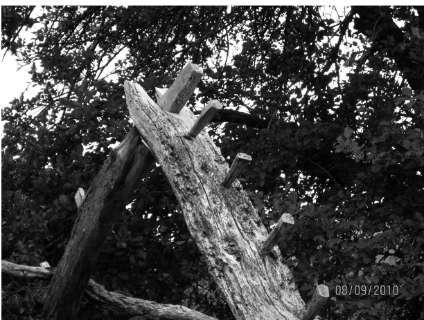
Puntas de madera que sujetan las correas

Habiendo concluido la rehabilitación del segundo conjunto de pajares por parte de Presidencia de Patrimonio de la Junta de Castilla y León, se pretende seguir con esta línea de actuación, consiguiendo con ello la recuperación completa de la era de Villar del Monte. Esperemos, pues, que todo tenga continuidad y se prevean también planes específicos en recuperación de cubiertas, chimeneas y hornos.