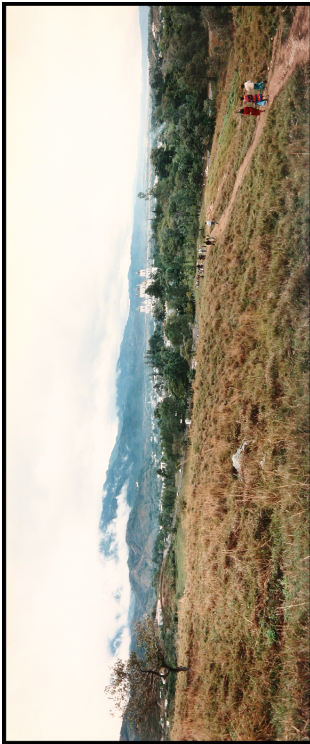
Camino a Esquipulas entre Las Minas y la Basílica, 14 de enero de 1994