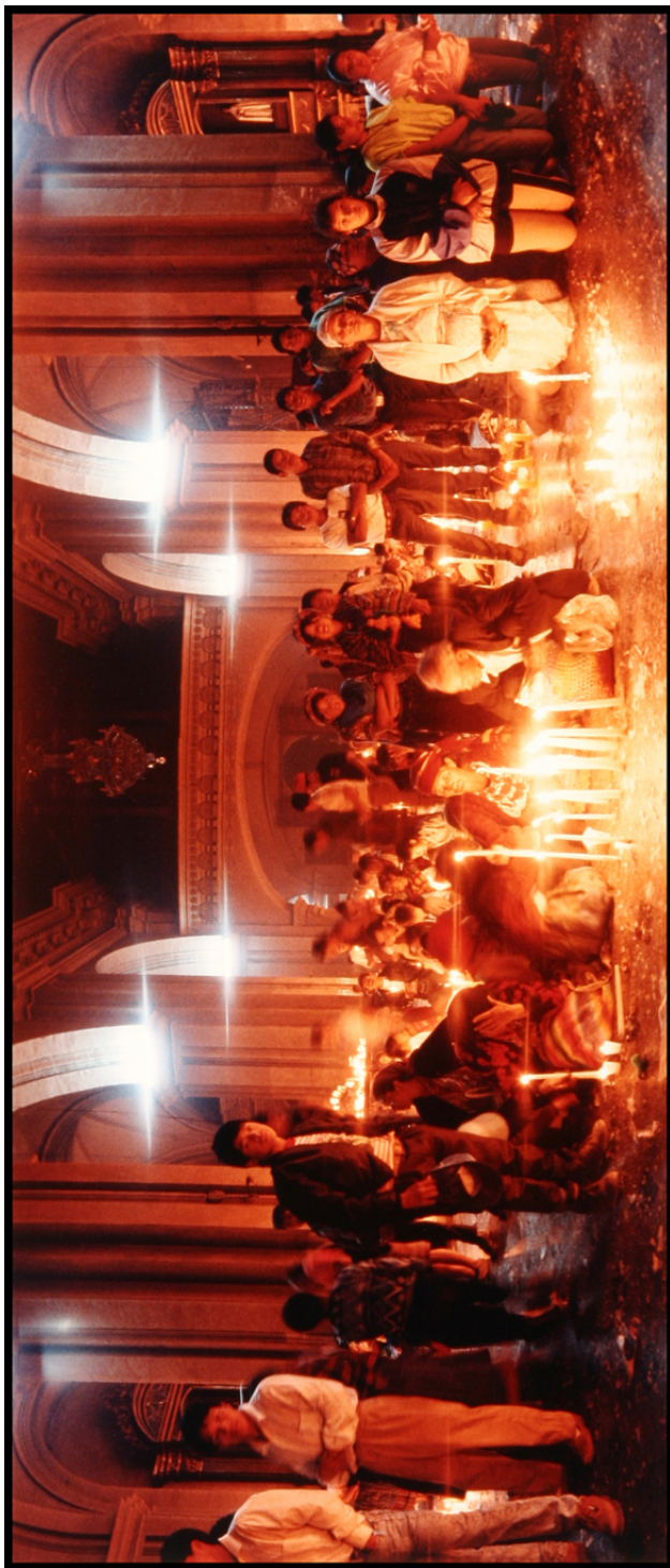
Peregrinos orando y realizando sus propios rituales religiosos antes de que el sacerdote oficie la ceremonia en el altar de la iglesia, 14 de enero de 1994