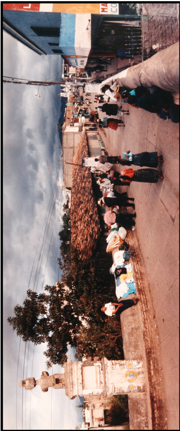
Calle Real, Esquipulas, calle que recorrió la imagen del Cristo Negro desde su iglesia parroquial hacia la recién terminada Basílica en 1759, y la ruta seguida por las principales procesiones en enero y Semana Santa, 14 de enero de 1994