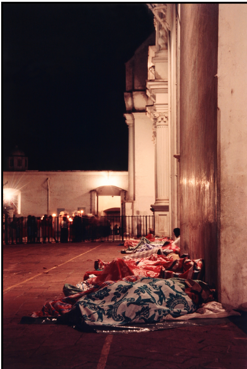
Peregrinos durmiendo junto a la Basílica, 29 de marzo de 1991