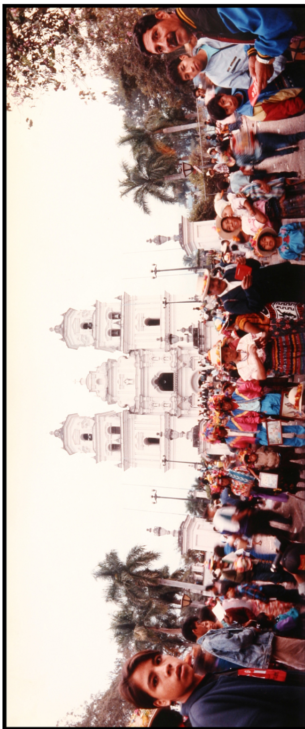
Panorama de los peregrinos frente a la Basílica, 15 de enero de 1994