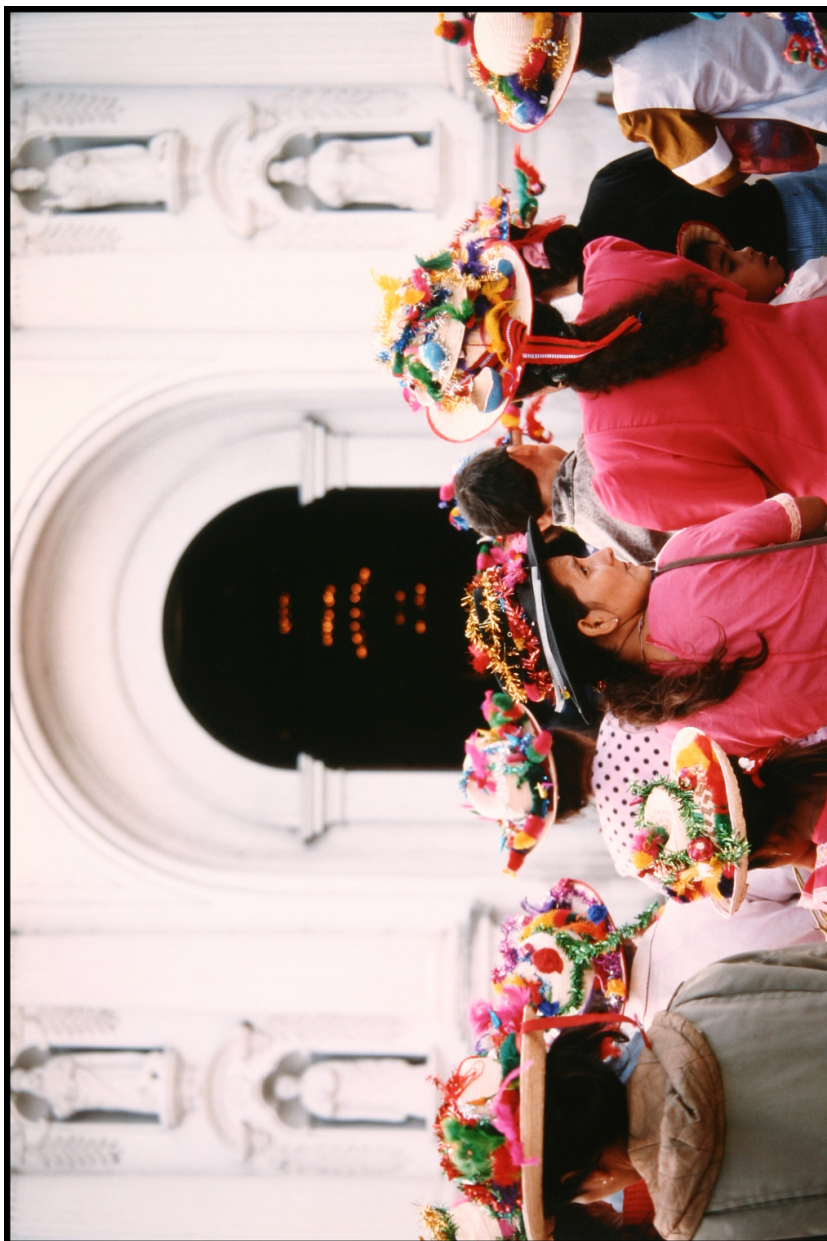
La gran mayoría de peregrinos que visitan Esquipulas son mujeres, 12 de enero de 1994