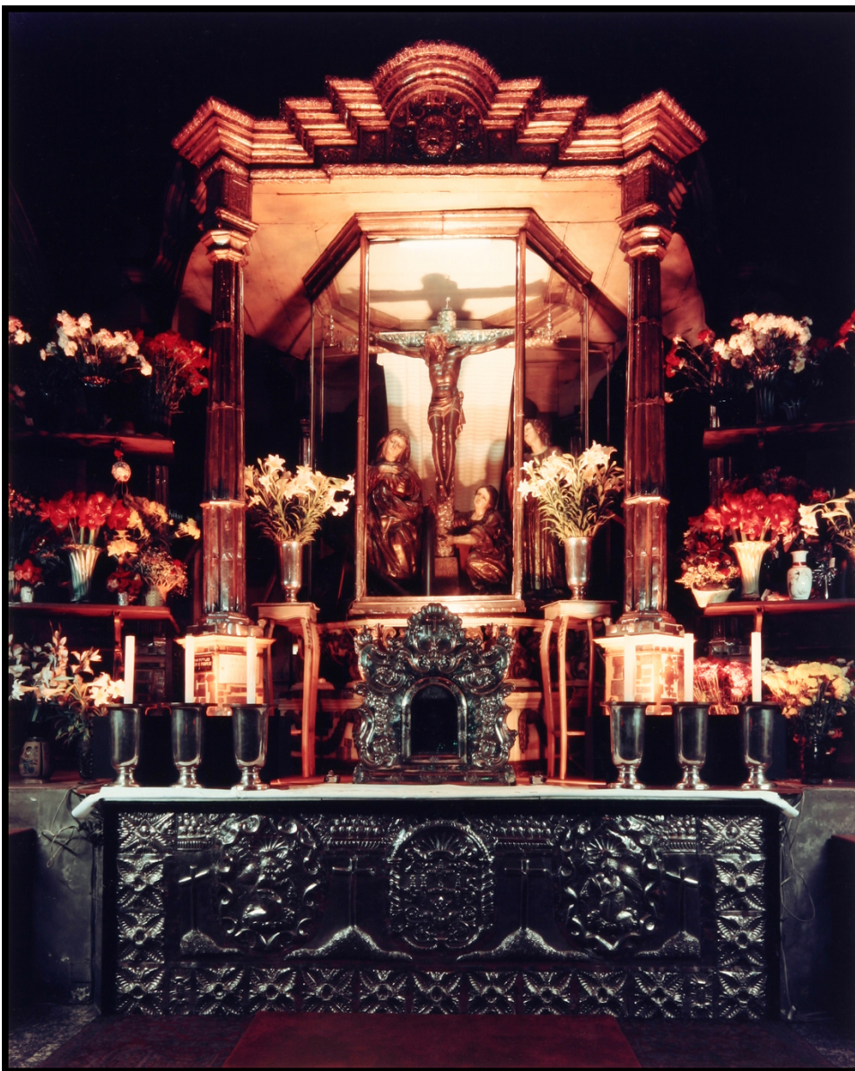
El Camerino del Cristo Negro crucificado de Esquipulas, 26 de marzo de 1991