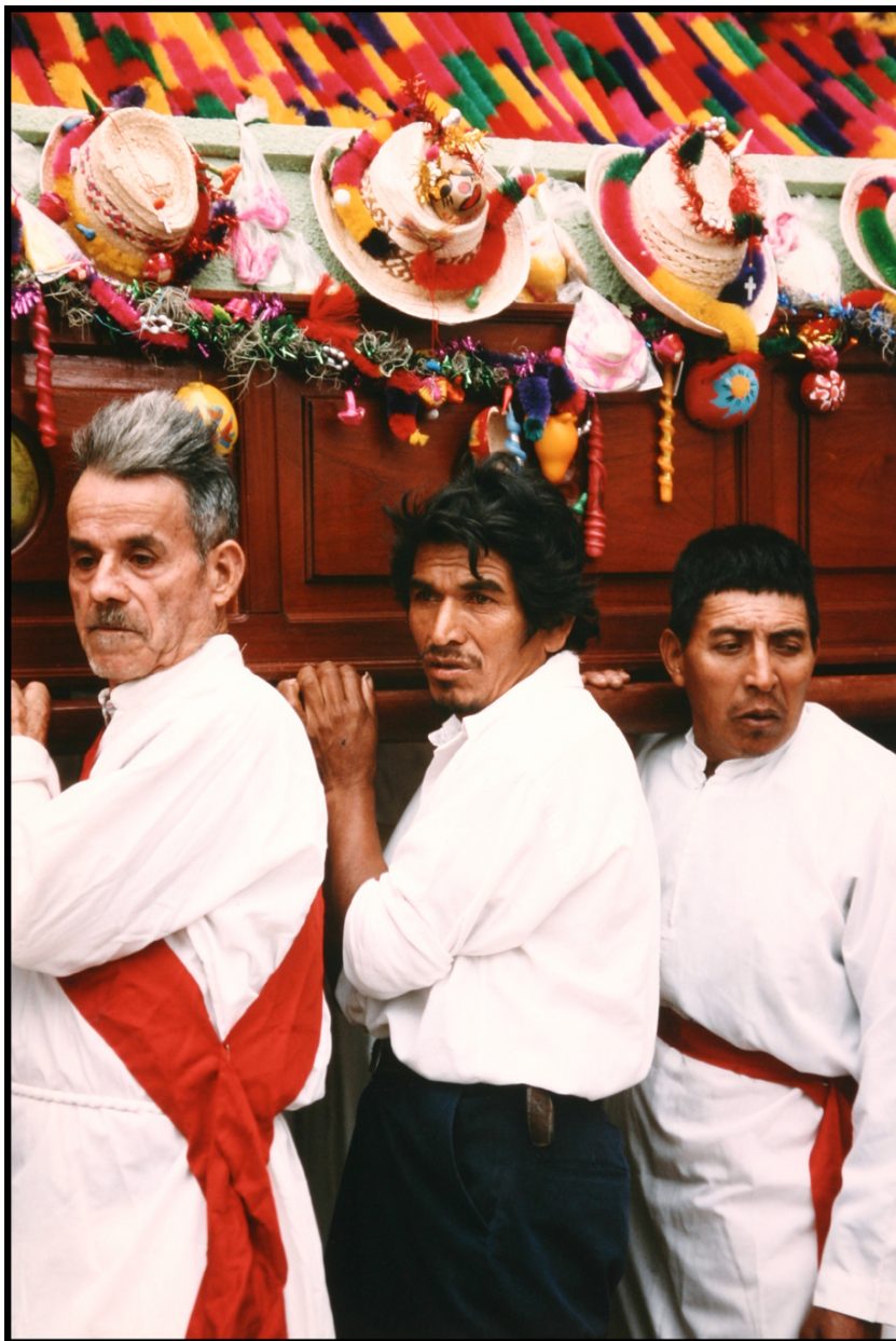
Miembros de la Sociedad Guadalupeana cargando un anda con la imagen del Cristo Negro hacia el santuario, 14 de enero de 1994