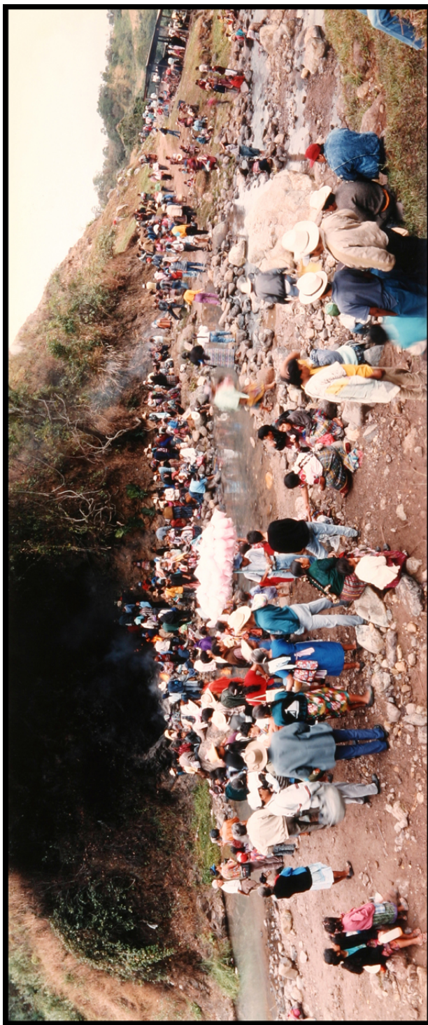
La cueva de Las Minas, en forma de cruz, es un lugar de veneración para los peregrinos, 14 de enero de 1994