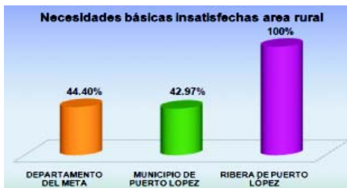
Figura 2. NBI Ribereños de Puerto López.

básicas insatisfechas, lo cual refleja gravedad social; con indicadores de NBI del 100 %, como se aprecia en la figura 1, muy por encima del indicador oficial que registra un 42,9 %, para el municipio y un 29,9% general nacional.