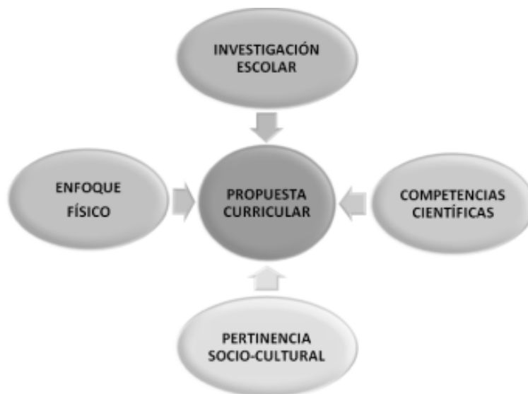
Figura 1. Estructura de la propuesta curricular para la enseñanza de las ciencias naturales

competencias científicas, rescatando la autonomía institucional y la pertinencia social-cultural del área de las ciencias naturales en la formación de los estudiantes, y con un enfoque físico que asume la física como el pilar conceptual de las ciencias naturales (Ver Figura 1).