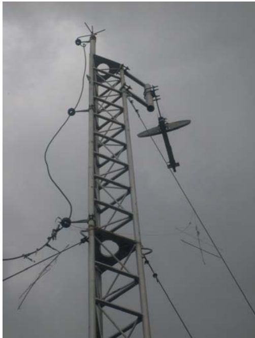
Figura 1. Torre situada na ONG Ação Comunitária do Brasil, na Vila do João

A cena descrita anteriormente suscita uma série de perguntas, entre elas: como e por que aquela torre foi construída? Por que naquele local? E, finalmente, como e por que aquela torre tornou-se um “cemitério de pipas”?