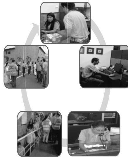
Fig. 1. Pasos a seguir en el simulacro de evacuación

En el simulacro del plan de evacuación de la empresa se siguió el siguiente procedimiento: avisar de un conato de incendio; en ese momento se indica que se deben apagar los equipos, y luego dar la orden de evacuar a todo el personal; ese proceso de muestra en la Fig. 1.