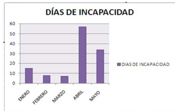
Fig. 3. Días de incapacidad 2009

Las Fig. 3 y 4 muestran el análisis de accidentalidad desde el 2009 hasta el 2010.