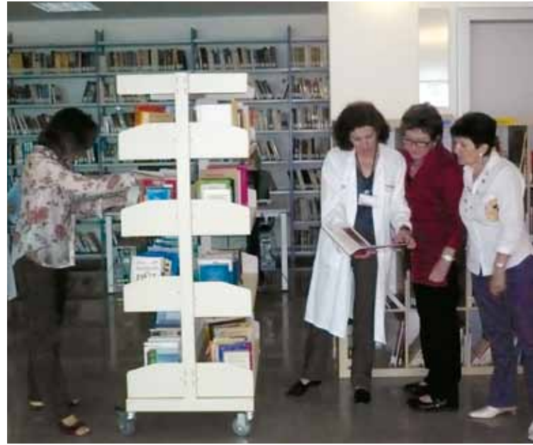
Biblioteca del hospital La Fe de Valencia.

Adquisiciones: Los fondos bibliográficos ingresados en la biblioteca desde su creación ascienden a 12.490 volúmenes; tras descontar pérdidas y expurgos, en la actualidad contamos con unos 10.000 volúmenes, agrupados en las siguientes materias: Arte (cine, fotografía, música, pintura). Autoayuda. Arquitectura. Biografías. Ciencias Aplicadas. Ciencias Sociales