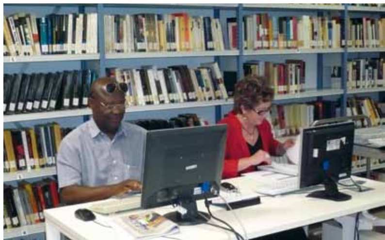
Biblioteca del hospital La Fe de Valencia.

Pérdidas: Más vale que se pierda un libro que un lector. Un bibliotecario es un difusor de cultura, de información, de recreo y en el caso de las bibliotecas de usuarios de hospital, un colaborador en la mejora psicológica de los enfermos. No se pueden poner trabas al préstamo de libros por miedo a que se pier-