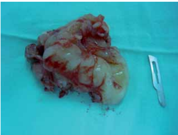
Figura 3. Fragmento del espécimen tumoral