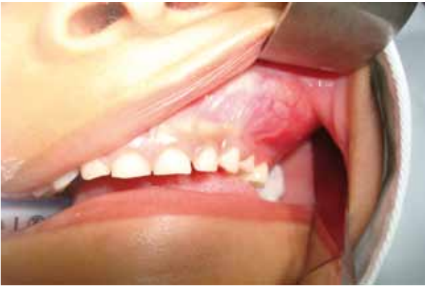
Figura 1. Aspecto clínico intraoral de lesión tumoral compatible con ameloblastoma